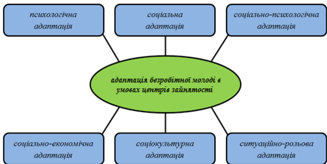
Рисунок 2.3 – Інформаційна модель адаптації безробітної молоді в умовах центрів зайнятості

Беручи до уваги вищезазначені міркування, вихідним зразком, який дасть змогу визначити алгоритм вирішення конкретних завдань, тобто обґрунтування програми, нами обрано інформаційну модель адаптації безробітної молоді в умовах центрів зайнятості та визначаємо її як вихідний еталон досліджуваного явища, що власне окреслює змістове наповнення. Інформаційна модель адаптації безробітної молоді в умовах центрів зайнятості має визначені автором конструкти, які представлено на рисунку 2.3.