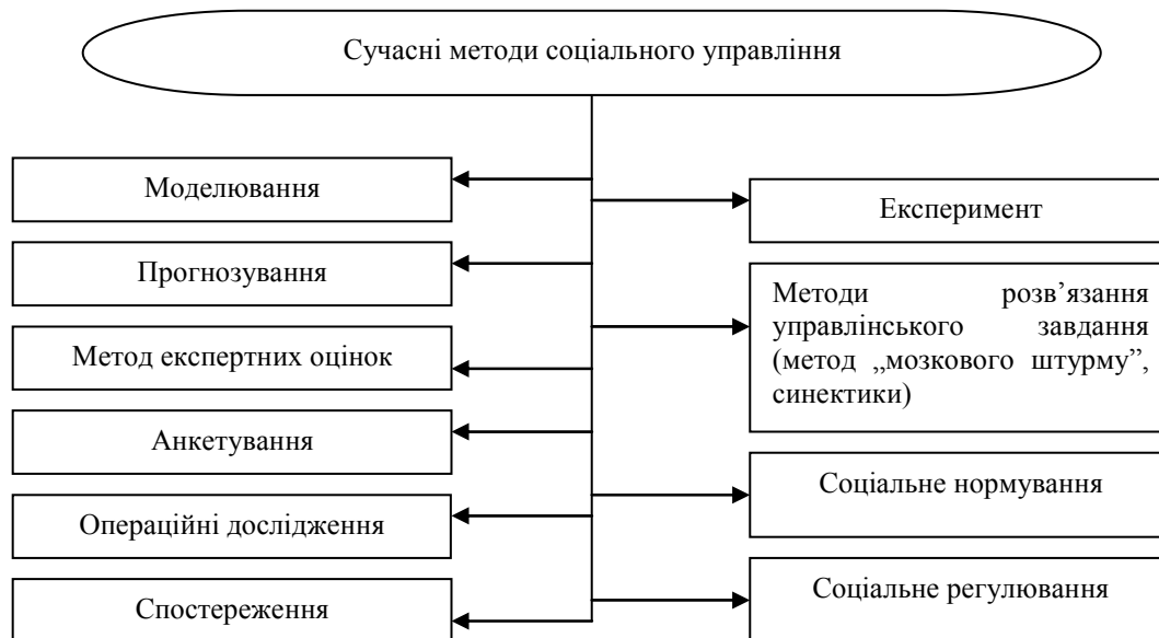
Рис. 2. Сучасні методи соціального управління

Одним із шляхів збільшення інформаційної змістовності моделей є розробка імітаційних моделей та їх випробування за допомогою комп'ютерних технологій. Це дозволяє оцінювати різноманітні альтернативи та їх дію в даних економічних і виробничих ситуаціях. Практика створення імітаційних моделей є широко розповсюдженою і результати їх використання є суттєвими. Метод моделювання необхідно застосовувати лише тоді, коли вивчення складних об'єктів неможливо здійснити традиційними методами і засобами. Модель виправдовує своє себе лише як джерело нового знання.