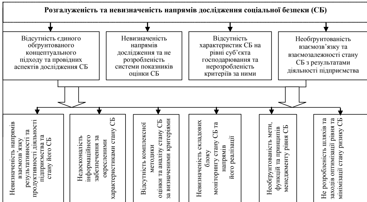
Рис. 1. Проблеми, що обумовлюють особливості управління соціальною безпекою підприємства

Узагальнення та систематизація існуючих теоретико-концептуальних підходів до поняття СБ, аналіз та синтез теоретичних напрацювань відповідно до КОСБ, нами представлено визначення яке, на нашу думку, відповідає вимогам часу та ґрунтується на зазначеній концепції. Соціальна безпека представляє собою комплексне поняття що характеризує кількісні і якісні характеристики діяльності суб'єкта господарювання та відображає взаємозв'язок та взаємозалежність результатів діяльності самого підприємства та його працюючих. Соціальна безпека, на нашу думку, є комплексне поняття, що представляє собою, з одного боку, характеристику продуктивності діяльності підприємства через рівень його соціальної стійкості, з іншого – характеристику результативності його діяльності через стан соціальної напруги.