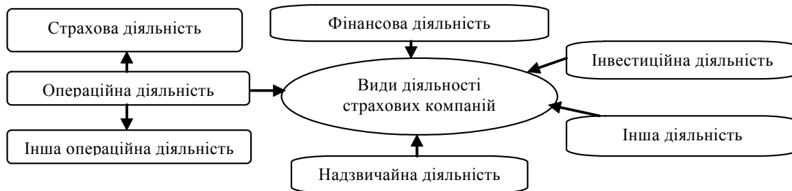
Рис. 2. Види діяльності страхових компаній

Незважаючи на досить широке коло досліджень зі страхування, які охоплюють різні сторони діяльності страхової компанії, в страховому законодавстві відсутні будь-які коментарі з приводу формування і врахування фінансових результатів страхових компаній. Оскільки страхове законодавство не містить цілісного та системного підходу до регламентації, визначення складу доходів та витрат страхової компанії воно потребує доповнень і уточнень. З огляду на вищевказане, необхідно уточнити поняття «фінансовий результат страховика» і проілюструвати види діяльності страхових компаній на рисунку 2.