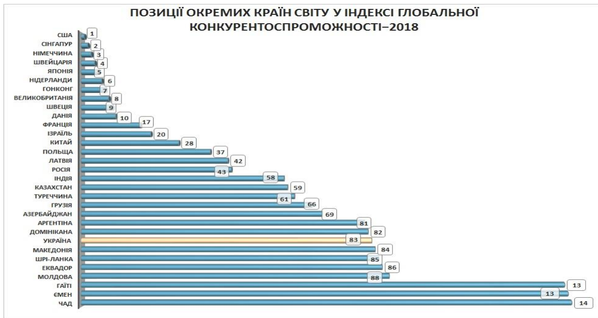
Рис. 3. Позиції країн світу за індексом глобальної конкурентоспроможності 4.0 у 2018 році [4]

Україна посіла 83 місце – у неї слабо розвинені інститути, вкрай нестійкі фінансова система і макроекономічні показники (рис. 3).