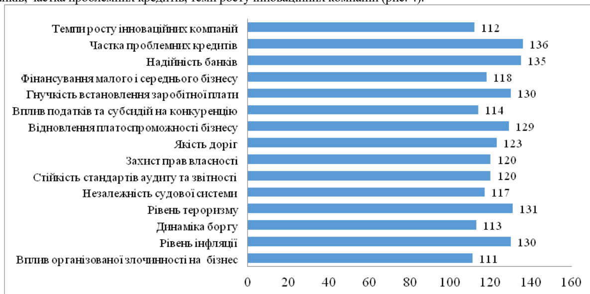
Рис. 4. Проблемні фактори конкурентоспроможності національної економіки

на конкуренцію, гнучкість встановлення заробітної плати, фінансування малого і середнього бізнесу, надійність банків, частка проблемних кредитів, темп росту інноваційних компаній (рис. 4).