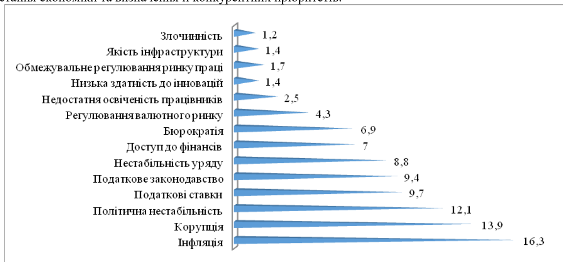
Рис. 5. Проблемні фактори для ведення бізнесу в Україні, %

чіткого законодавства та нормативного забезпечення, основних інститутів ринку та ринкової інфраструктури. Як показали дослідження міжнародних рейтингів, для досягнення високого рівня конкурентоспроможності національної економіки необхідно змінити пріоритетні напрями економічного розвитку в сучасному глобалізованому просторі, визначити нові чинники, здатні забезпечити конкурентні переваги у довгостроковій перспективі. Основним завданням для національних компаній мають стати збереження наявного потенціалу конкурентоспроможності та розширення виробництва за рахунок впровадження сучасних технологій, інноваційних розробок, розширення асортименту товарів. Також необхідно сформувати стабільне конкурентне середовище на основі міжнародних норм і стандартів, яке спонукає до конкуренції на глобальному рівні та надає можливості для ефективної конкурентної поведінки суб'єктів господарювання. Ще одним із пріоритетних напрямів економічної політики є перерозподіл матеріальних і фінансових ресурсів за інноваційними напрямками економічного розвитку, з метою становлення та розвитку інформаційного суспільства. Таким чином, інновації стають потенціалом для зростання економіки та визначення її конкурентних пріоритетів.