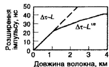
Рис. 1. Залежність розширення імпульсу від довжини багатомодового оптичного волокна[1]

Розглянемо основні джерела шуму при прийманні оптичних сигналів. Існує дві фундаментальні причини зниження якості сигналу в процесі його приймання за рахунок наявності дробового шуму в самому оптичному сигналі і теплового(або дробового) шуму у приймальному пристрої.