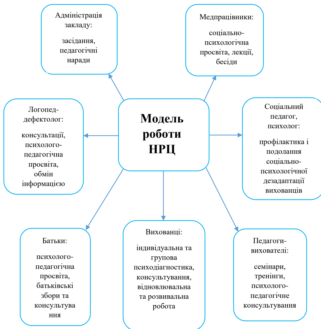
Рис.1.1 – Модель роботи навчально-реабілітаційного центру

Схематично діяльність навчально-реабілітаційного центру можна зобразити наступним чином: