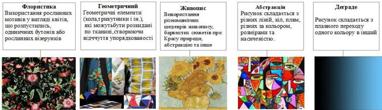
Рис. 3. Різновиди актуальних принтів 2019–2020 рр.