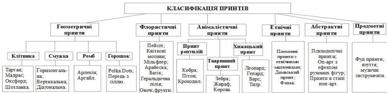
Рис. 2. Класифікація сучасних принтів