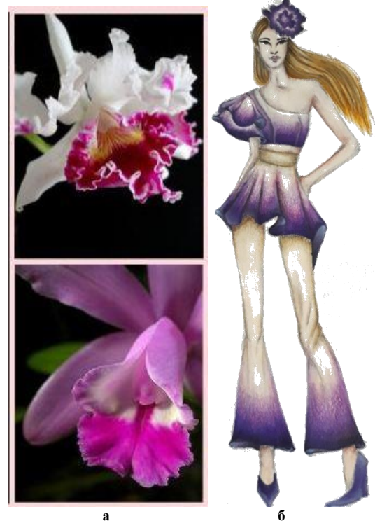
Рис. 5. Ескізний проект ансамблю жіночого святкового одягу під девізом «Каттлея»: а – джерело творчості, б – ескіз ансамблю

Наступним етапом є фарбування матеріалу в техніці деграде. Залежно від структури тканини використовуються різні методи нанесення принту на одяг [8–10]: трансферний друк, трафаретний трансфер, ручний розпис, сублимаційний друк, шовкографія. В процесі пошуку найбільш раціональної технології фарбування тканини обрано технологію сублимаційного друку. В основі цієї технології – спеціальні барвники, які під дією температури і тиску проникають глибоко в структуру тканини. Для сублимаційного нанесення застосовують спеціальні сублимаційні фарби, здатні до переходу в газоподібний стан. За допомогою принтера цими фарбами друкується зображення на відповідному сублимаційному папері, що