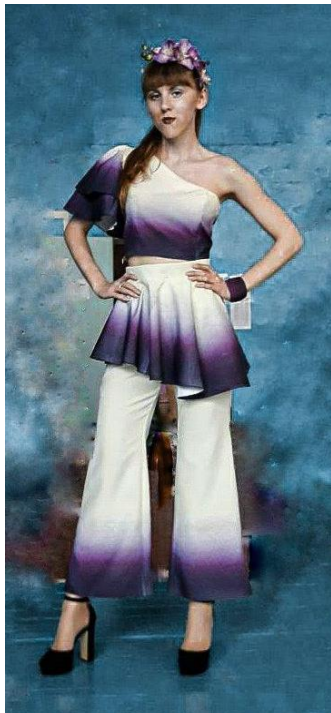
Рис. 6. Виготовлений авторський ансамбль під девізом «Каттля»

Розроблені три зразки градієнтів віддруковані на принтері Epson PX-1004 сублимаційними фарбами та перенесені на тканину габардин за допомогою промислового пресу для дублювання DISON DS-38. Температура нагрівання поверхні становила 200°C, час дублювання – 1 хв.