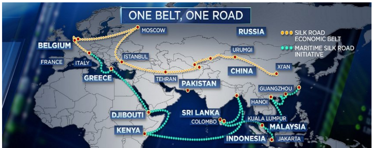
Рис 1.1. Географічне зображення ініціативи «Один пояс – один шлях»

Таким чином, важливо відзначити, що на сучасному етапі основою зовнішньої політики Китаю є концепція «спільноти єдиної долі людства». Ця концепція покладає акцент на принципи взаємної поваги, рівноправності, загального розвитку і визнання різноманітності цивілізацій і культур. З метою будівництва цієї «спільноти долі» Китай активно сприяє створенню нового типу міжнародних відносин і продвигає ініціативи в галузі глобального розвитку та глобальної безпеки. Це відображає стратегічне бачення КНР щодо нового міжнародного порядку та системи глобального управління, які ґрунтуються на китайських традиціях та цінностях, свідчаючи про зростання глобальних амбіцій Китайської Народної Республіки.