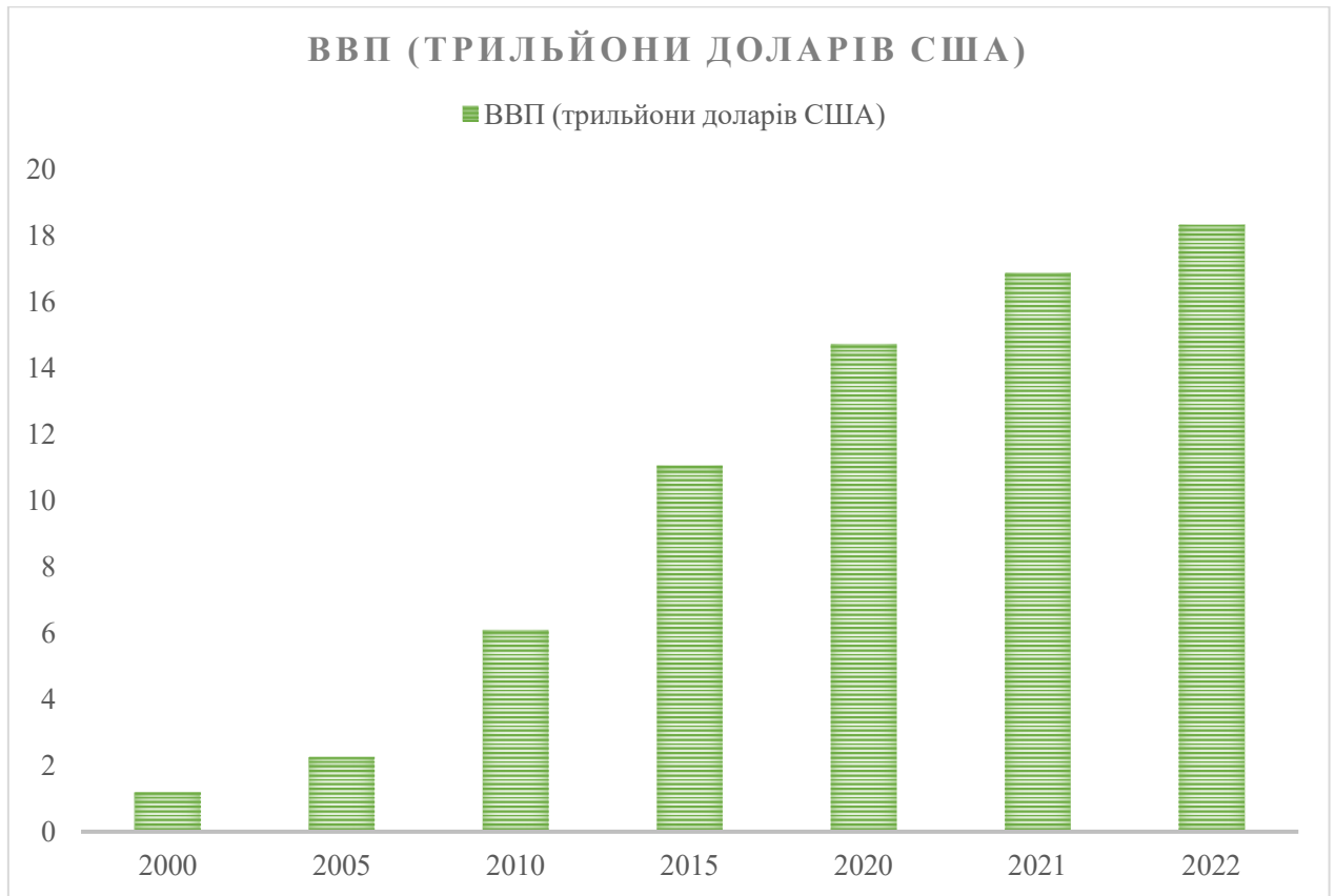
Рис. 1.2. ВВП Китаю 2000-2022 рр. ( трильйони дол.США)

Джерело: Національне бюро статистики Китаю