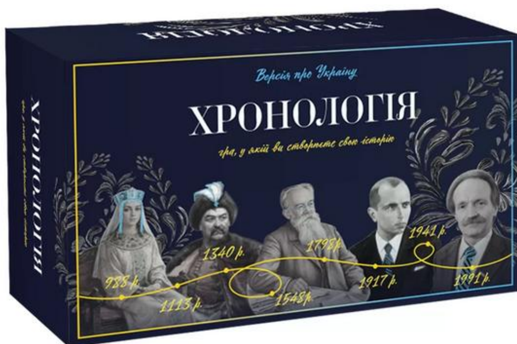
Рисунок 2.8 — Приклад гри з історичною тематикою

Таким чином, історичний розвиток настільних ігор демонструє їхню універсальність, культурну гнучкість і здатність до трансформації, що дозволяє їм залишатися актуальними і в наш час.