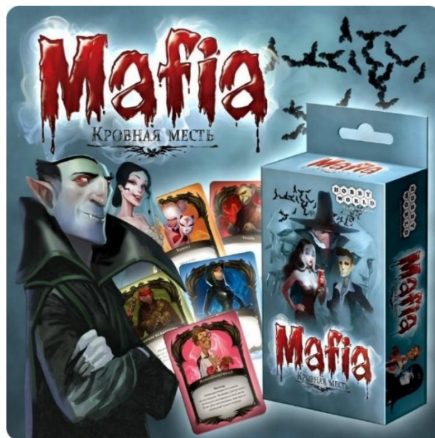
Рисунок 1.11 — «Кровава помста»