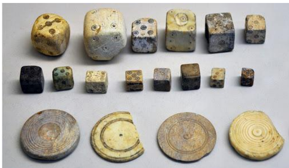
Рисунок 2.4 — Древня гра в кістки

«Кістки», які у сучасному світі є звичним ігровим елементом, у давнину виконували магічну та ритуальну функцію (рис. 2.4). Вони виготовлялися з кісток тварин, насіння, дерева, а для представників аристократії — із дорогоцінних матеріалів, включно з металами та камінням. Археологічні знахідки таких кісток зафіксовані як у Єгипті, так і в Китаї.