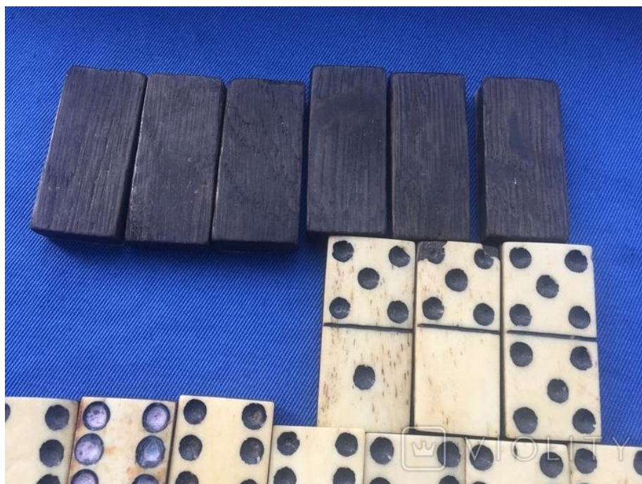
Рисунок 2.6 — «Доміно» з дерева та кістки

«Доміно», на відміну від багатьох древніх ігор, дозволяло брати участь одночасно декільком гравцям. Його популярність зросла у XII столітті, а назва гри пов'язана з аналогією з чорним зимовим вбранням католицьких священнослужителів. Перші комплекти виготовлялися зі слонової кістки та дерева (рис. 2.6).