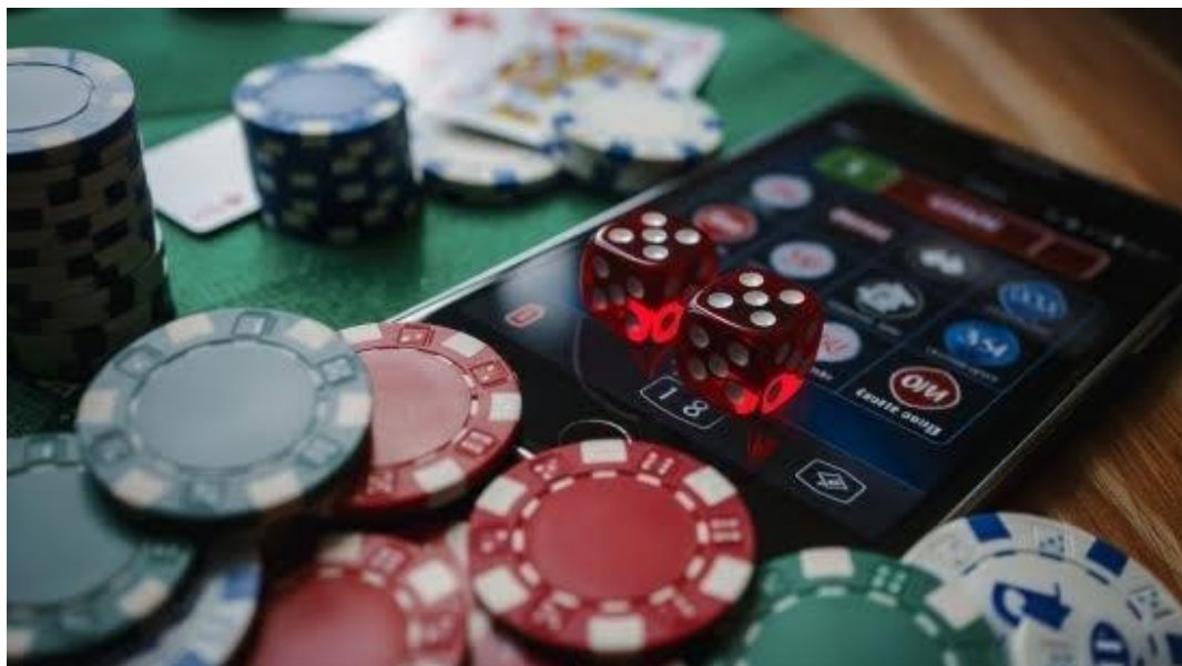
Рисунок 1.4 — Азартні настільні ігри

5. Психологічні настільні ігри. Прикладом є всесвітньо відома гра «Мафія», яка передбачає рольову взаємодію, блеф, командну гру та аналіз поведінки інших гравців та своєї власної (рис. 1.5). Класика психологічних ігор з кримінальним сюжетом, яка кілька десятиліть виходить в лідери продажів в різних країнах. Також до цієї категорії належать ігри, що орієнтовані на вивчення психологічних реакцій та емоційного інтелекту. Вони моделюють соціальні ситуації, в яких гравці виконують ролі, приховують або розкривають інформацію, взаємодіють на рівні інтуїції, блефу, спостереження та аналізу поведінки. Основні характеристики: орієнтовані на розвиток емоційного інтелекту, вимагають уважності до невербальних сигналів, часто використовують приховані ролі та обман. Приклади: