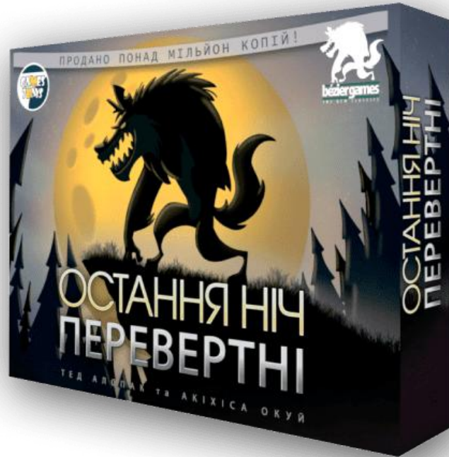
Рисунок 1.10 — «Остання ніч: Перевертні»

Завдяки такому підходу гра залишається привабливою як для підліткових компаній, так і для сімейного дозвілля чи тимблдингу.