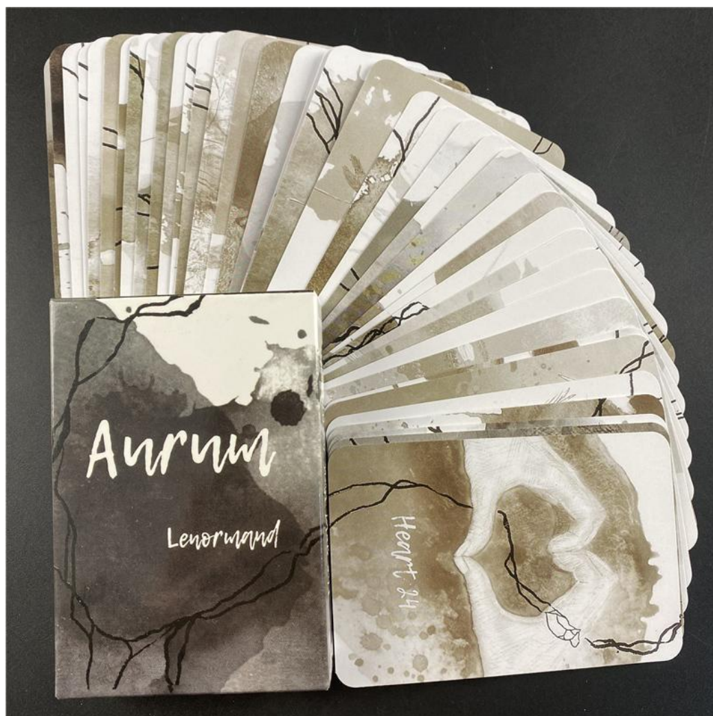
Рисунок 2.15 — Картки «Aurum»

Encarded були видані серії Aurum [19], Deco, Zenith, Chancellor, Celestial, які стали предметом інтересу численних колекціонерів (рис. 2.15).