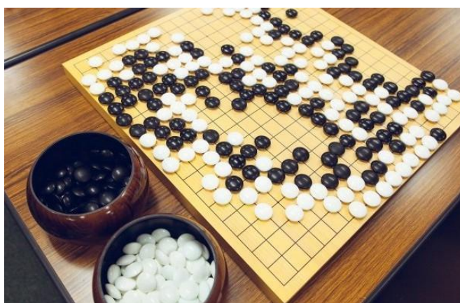
Рисунок 2.3 — Древня настільна гра «Го»

У Китаї важливе місце займала гра «Го», що втілювала філософські принципи гармонії та дуалізму буття (рис. 2.3). Чорні й білі камені, які поступово розміщуються на ігровій дошці, символізували рівновагу між протилежними силами. Гра вимагала високого рівня концентрації та стратегічного передбачення, перетворюючись на справжнє мистецтво мислення.