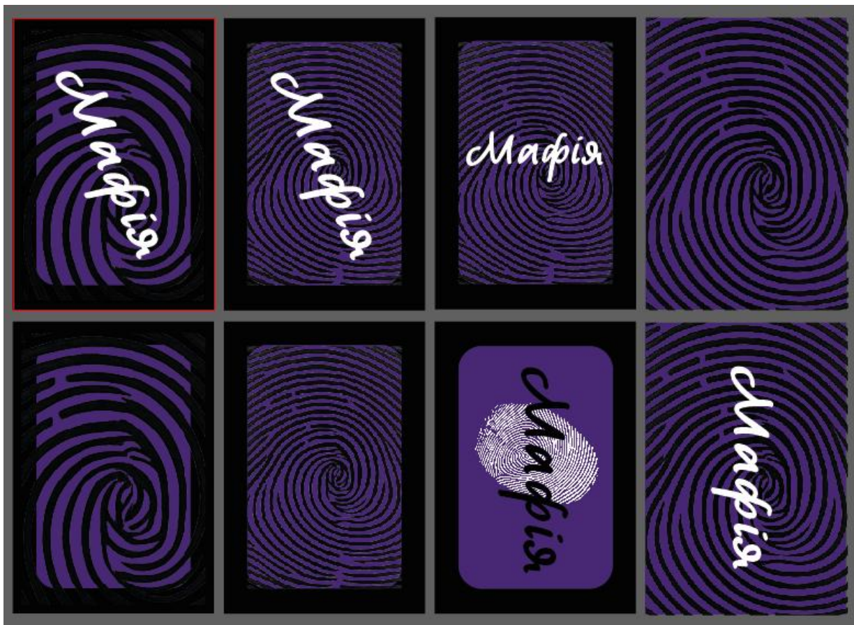
Рисунок 3.5 — Варіанти сорочок карт

Таким чином, етап розробки ескізів дозволив не лише визначити основний візуально-композиційний підхід, але й виявити функціональні, символічним та емоційні параметри графічного оформлення. В результаті були закладені основи для створення цілісного та візуально впізнаваного образу гри, що підсилює занурення користувача в ігровий процес та сприяє формуванню стійкої візуальної ідентичності продукту.