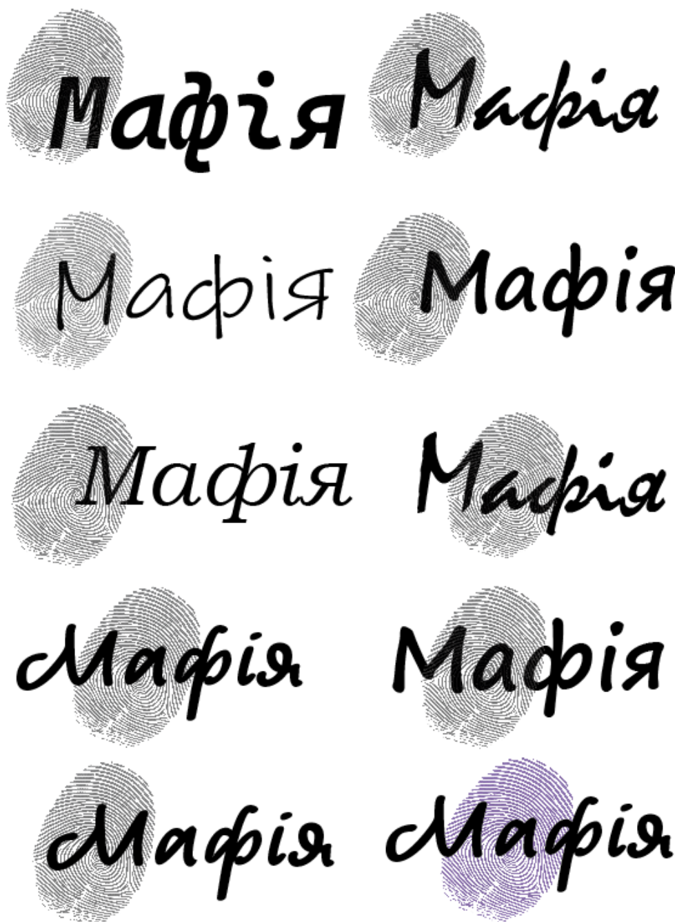
Рисунок 3.3 — Пошук шрифтра

Також було створено варіанти логотипу гри, з експериментами у шрифтах (рис. 3.3) та композиційному розміщенні декоративного елемента — відбитка пальця (рис. 3.4), який слугує символом персоніфікації, слідства, індивідуальності та є відомим атрибутом детективних історій.