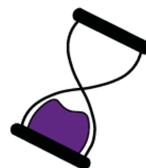
Рисунок 3.9 — Частина інструкції