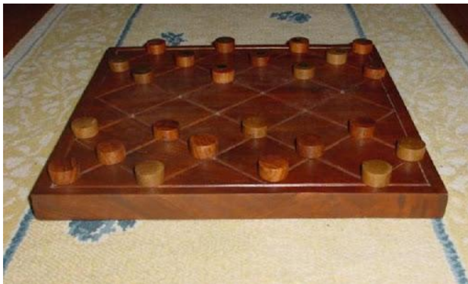
Рисунок 2.5 — Один з перших дизайнів «Шашок»

«Доміно», на відміну від багатьох древніх ігор, дозволяло брати участь одночасно декільком гравцям. Його популярність зросла у XII столітті, а назва гри пов'язана з аналогією з чорним зимовим вбранням католицьких священнослужителів. Перші комплекти виготовлялися зі слонової кістки та дерева (рис. 2.6).