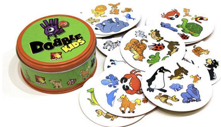
Рисунок 1.7 — . Розвивальні настільні ігри для дітей

8. Спортивні настільні ігри — це симуляційні ігри, які поєднують фізичну активність з настільним форматом. (рис. 1.8) Часто використовуються для розваг на природі, в офісі, вдома або в дитячих гуртках. Основні характеристики: поєднання елементів спорту і гри, часто мають реалістичну або спрощену механіку реального виду спорту, орієнтовані на рухову активність та змагальність. Приклади: