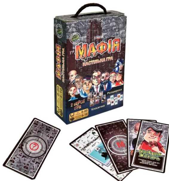
Рисунок 1.14 — Мінімальна комплектація «Мафія»

Варто зазначити, що сам факт використання усталених графічних шаблонів не є проблемою, адже вони формують впізнаваність гри. Проте важливим залишається питання оригінальності подачі та інтерпретації цих візуальних кодів з урахуванням цільової аудиторії та сучасного стилю. Більшість доступних у продажу варіантів гри «Мафія» мають мінімальну комплектацію — картки з ролями та інструкцію (рис. 1.14). Такий базовий набір хоч і зручний для масового виробництва, однак не враховує потенціал повного занурення гравців у сюжетно-рольовий простір.