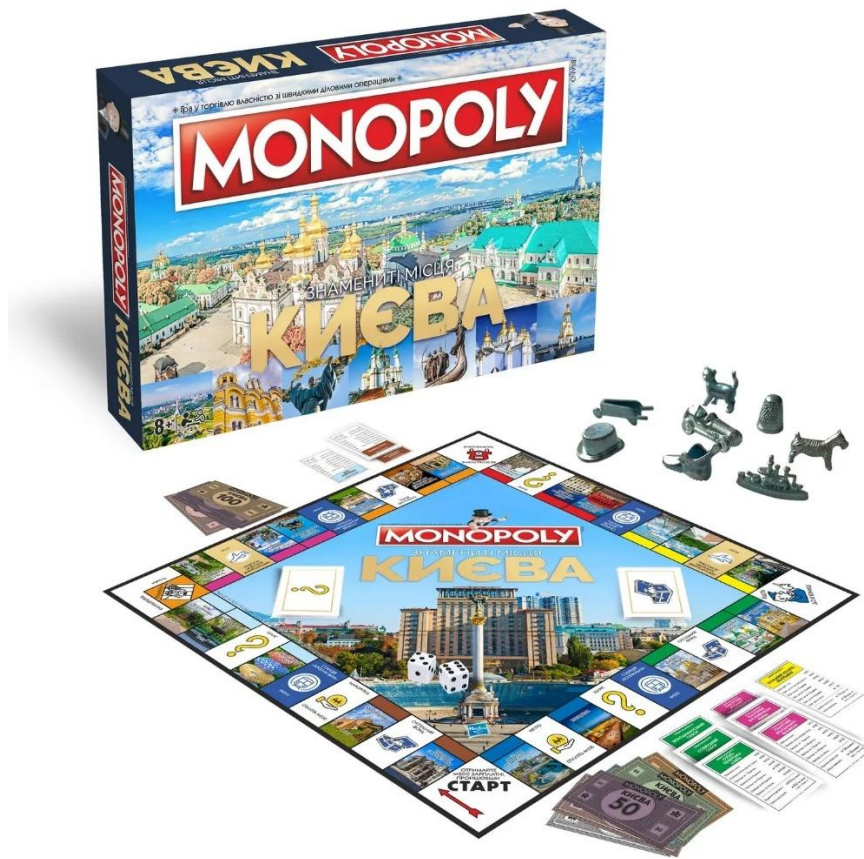
Рисунок 1.6 — Економічні настільні ігри

7. Розвивальні настільні ігри для дітей — призначені для наймолодшої аудиторії. Мають на меті розвиток дрібної моторики, просторового мислення, координації, кольорового сприйняття та пам'яті (рис. 1.7). Розвивальні ігри для дітей спеціально адаптовані до вікових особливостей. Основні характеристики: відповідають психофізіологічним особливостям дітей 3–7 років, побудовані за принципом гра-навчання, мають прості правила, велику кількість візуальних стимулів. Приклади: