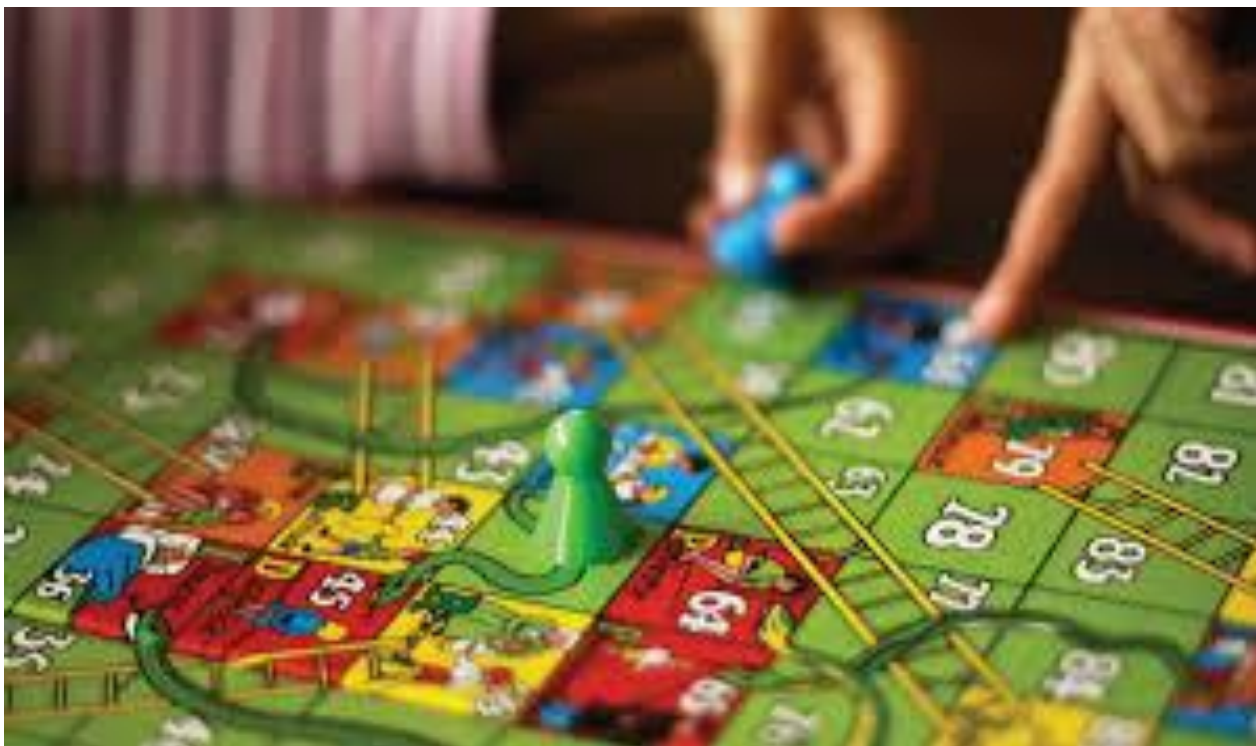
Рисунок 1.2 — Ігри типу «ходилка»

3. Логічні настільні ігри — розраховані як на індивідуальну, так і на групову участь, часто виконують роль тренажера логіки в домашніх умовах (рис. 1.3). Виробники щорічно презентують сотні нових логічних настолок, це можуть бути як абсолютно нові ігри, так і оригінальні інтерпретації класики. Наприклад, у продажу можна зустріти безліч видів легендарних «шахи», «нарди», «кубик рубика». Основні характеристики: розвиток критичного мислення, просторового та стратегічного мислення, варіативність рішень та підходів. Приклади: