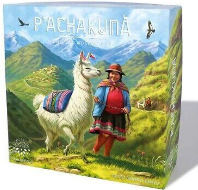
Рисунок 2.11 — Приклад гри з культурною автентичністю

3. Гумористичний стиль (рис. 2.12). Ігри, орієнтовані на сатиру та іронію, активно використовують елементи карикатури, колажу, гротеску, а також сюжетні теми, близькі до повсякденності або соціальних реалій [8]. Гумористичний дизайн часто виступає носієм критичних ідей або культурних алюзій, що надає грі додаткову смислову глибину.