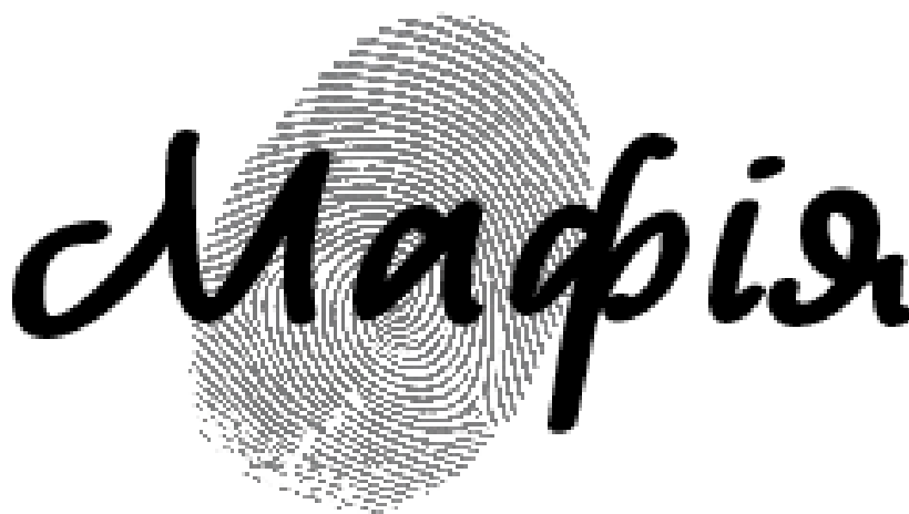
Рисунок 3.6 — Логотип

Типографічне рішення також підкріплює концепцію. У якості основного шрифту було обрано «AndrijScript Cyrillse» — рукописний шрифт, створений українським дизайнером Андрієм Шевченком [21]. Його каліграфічна пластика вносить нотку індивідуальності, водночас зберігаючи функціональну зручність. А також робить відсилання на класичну «Мафію» в дизайні якої часто використовується рукописні шрифти. Розміщення назви ролі в нижній частині картки забезпечує швидке сприйняття інформації, не порушуючи композиційного балансу (рис 3.6).