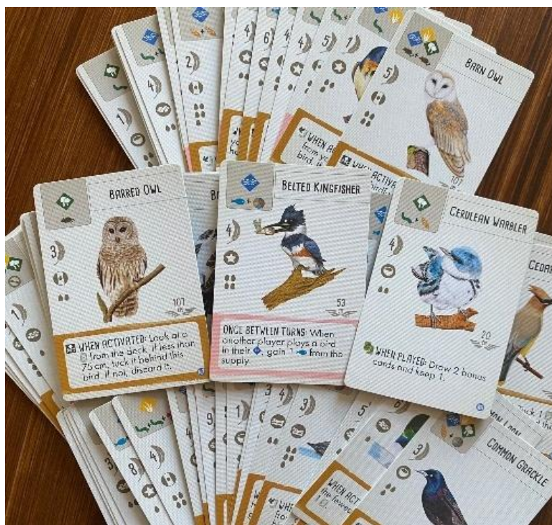
Рисунок 2.10 — Приклад функціонального мінімалізму

1. Функціональний мінімалізм (рис. 2.10). У дизайні дедалі частіше простежується відхід від візуальної перевантаженості на користь структурованості, чіткості форм та обмеженої кольорової палітри. Перевага надається пастельним або глибоким монохромним відтінкам. Такий підхід не відволікає гравця від суті гри, а навпаки – підкреслює логіку механік та сприяє швидкому засвоєнню ігрових принципів.