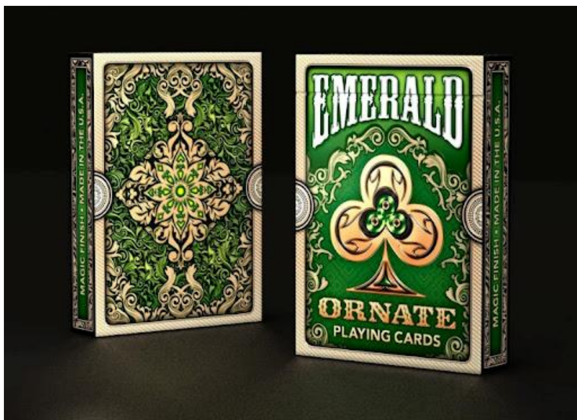
Рисунок 2.14 — Картки «Ornate»