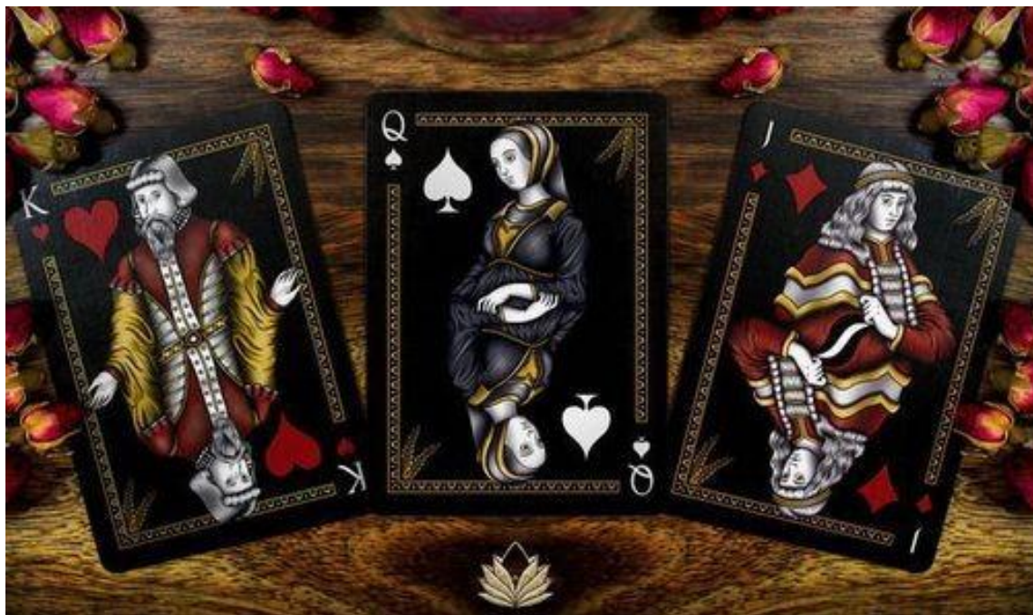
Рисунок 2.16 — Картки «Apothecary»

Таким чином, сучасний дизайн настільних ігор вийшов далеко за межі графічного оформлення та став поєднанням інформативності, емоційності, комунікаційної ефективності та брендингової стратегії. Тенденції мінімалізму, культурного занурення, гумористичної інтерпретації та атмосферної ілюстрації формують нову якість взаємодії з грою. Водночас постаті дизайнерів, таких як Ренді Баттерфілд, Пол Карпентер та Олександр Чін, визначають художній рівень індустрії, просуваючи її межі в бік інновацій, колекціонування й мистецької експресії.