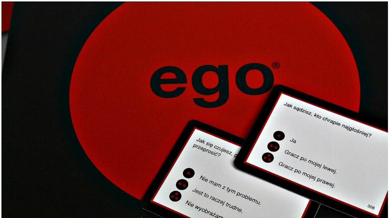
Рисунок 1.5 — Психологічні настільні ігри

6. Економічні ігри розвивають навички планування, управління ресурсами, фінансової грамотності (рис. 1.6). В ігровій формі демонструють основи економічного мислення. Настільні ігри, що симулюють економічні процеси, пов'язані з управлінням ресурсами, торгівлею, інвестуванням або розподілом капіталу. Вони можуть бути як освітніми, так і стратегічними. Подібні ігри можуть розкрити вашу підприємницьку жилку. Основні характеристики: формують навички планування та стратегічного мислення, розвивають розуміння економічних понять, орієнтовані на підлітків та дорослих. Приклади: