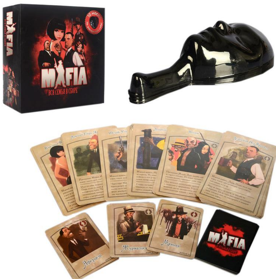
Рисунок 1.15 — Розширена комплектація гри «Мафія»

Такі елементи підсилюють занурення в гру, створюють стилістичну цілісність та сприяють емоційному включенню гравців у процес. Вони також роблять продукт більш конкурентоспроможним у візуальному середовищі, де дизайн є вирішальним чинником вибору серед аналогічних ігор.