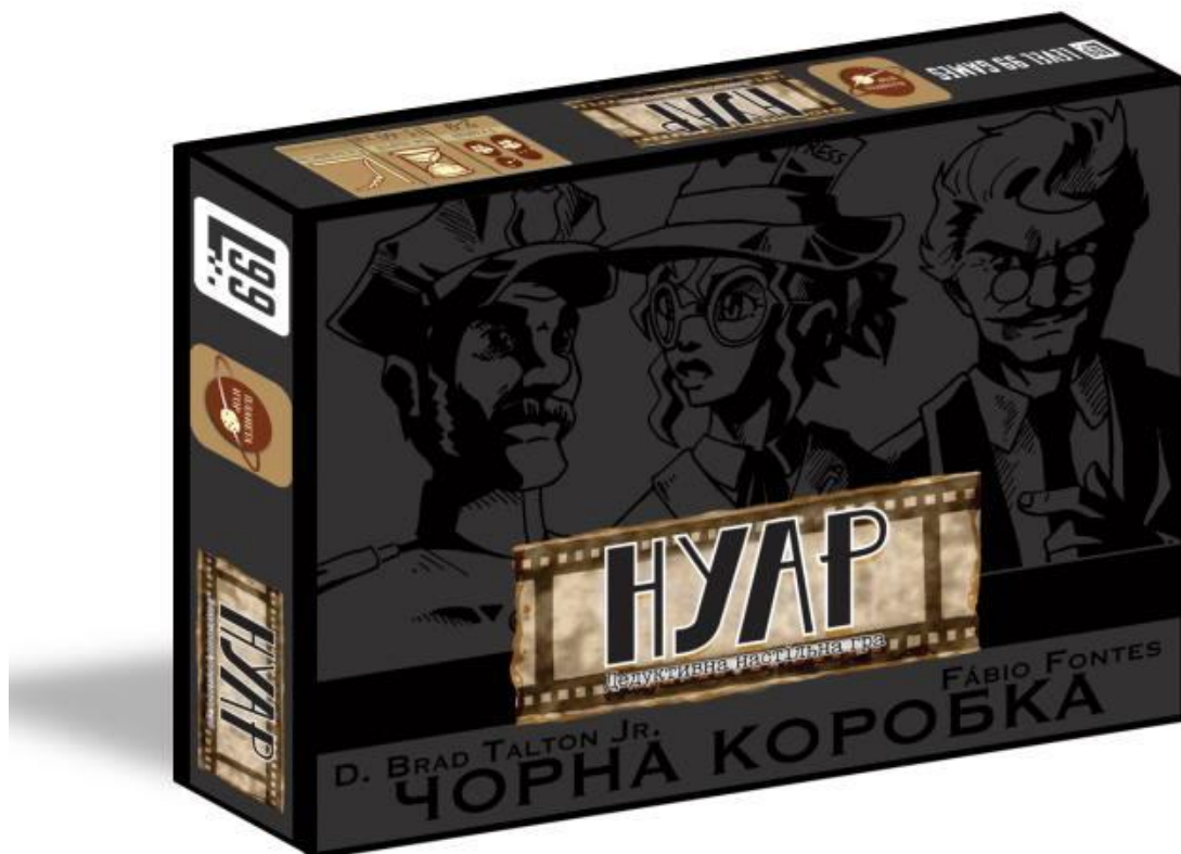
Рисунок 1.12 — Класична «Мафія»