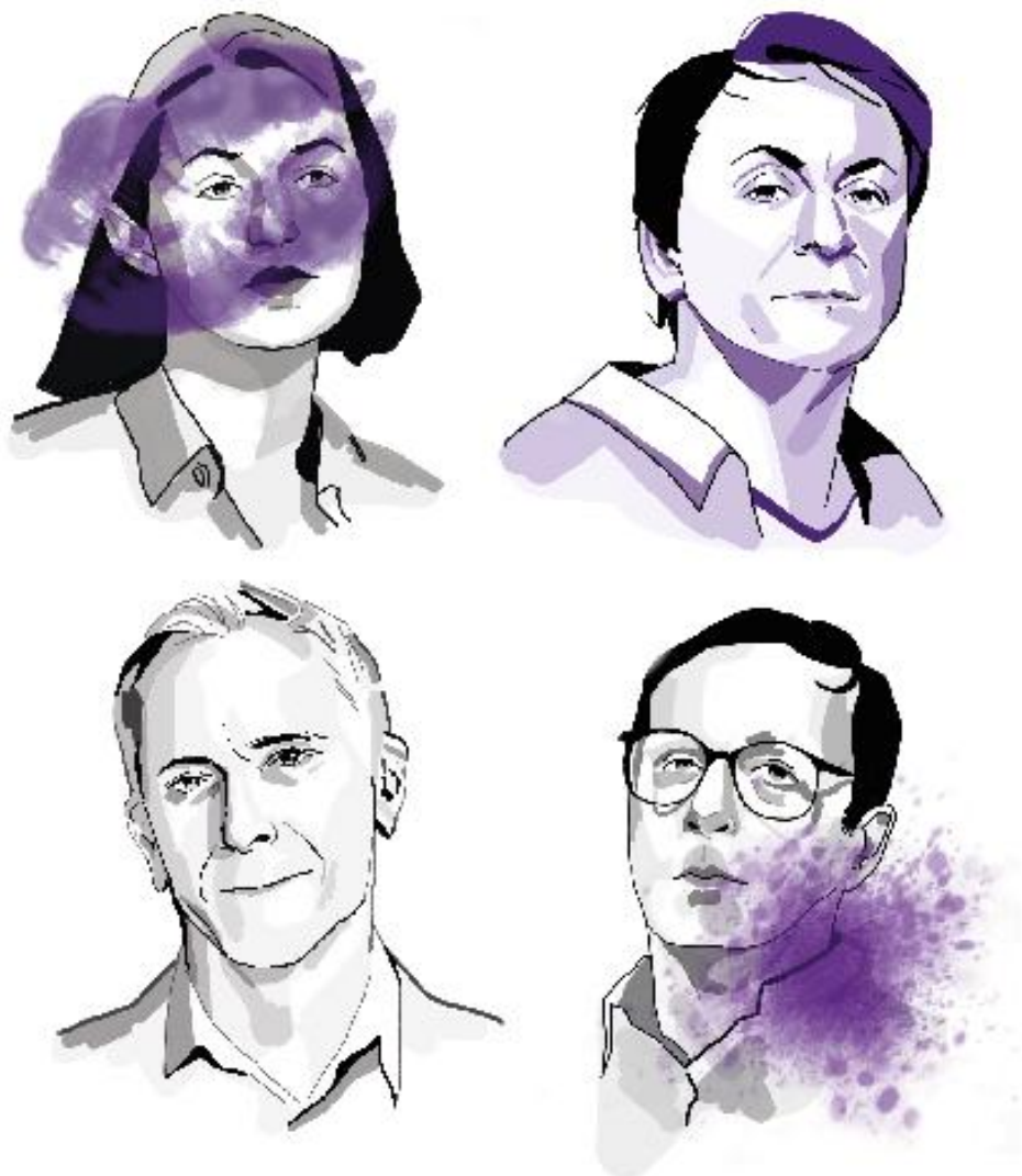
Рисунок 3.7 — Ілюстрації для карток

соціальну приналежність (рис. 3.7). Ефект «перехожого» як рішення дозволяє гравцям не формувати упереджених вражень про персонажів, що підтримує ідею психологічної гри, в якій справжній зміст ролі розкривається через дії, а не зовнішність. Також це передбачує спробу гравця відіграти роль, тим самим надавши підказку іншим гравцям про свою роль [22].