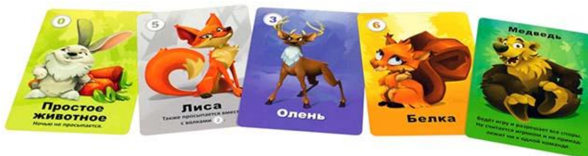
Рисунок 1.9 — Адаптації гри «Мафія» для дітей

Підлітки та молодь сприймають гру інакше: у випадку з підлітками особливу роль відіграє нестандартний та естетично привабливий дизайн. Наприклад, такі версії, як «Остання ніч: Перевертні» (рис. 1.10) чи «Кровна помста», (рис. 1.11) вирізняються сюжетною адаптацією, новими ролями, та високим рівнем візуального опрацювання. Їхній успіх зумовлений низкою дизайнерських рішень: