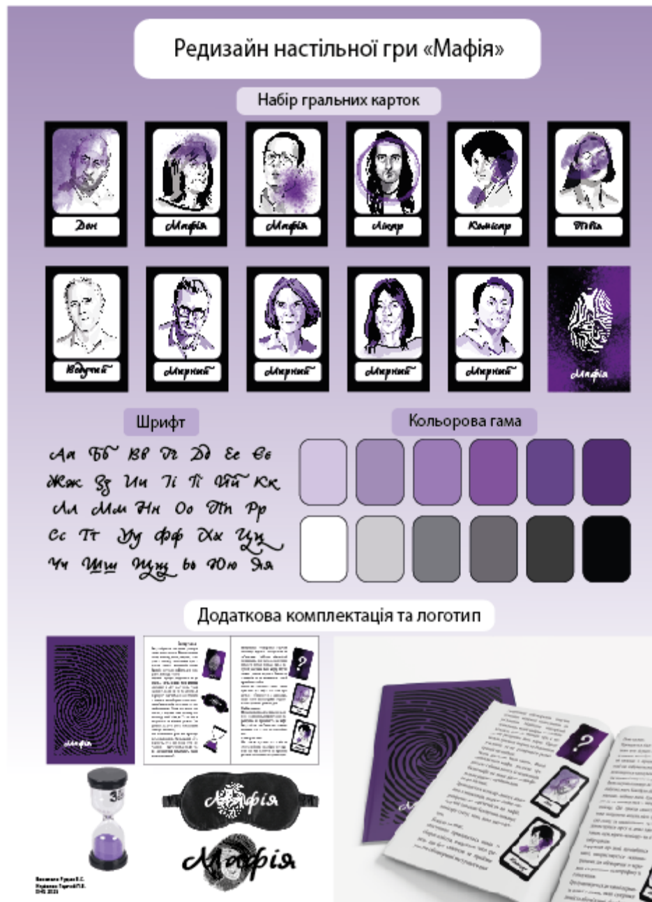
Рисунок А.1 — Стендова доповідь з результатами роботи над кваліфікаційною роботою