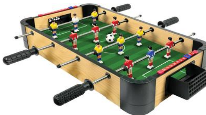
Рисунок 1.8 — Спортивні настільні ігри