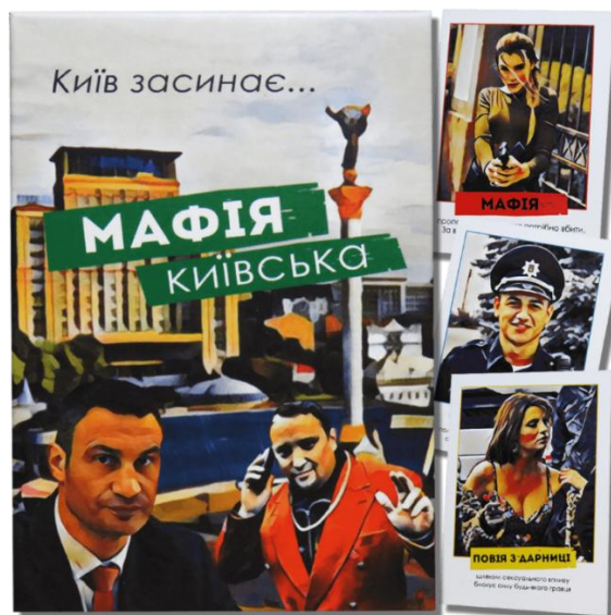
Рисунок 2.12 — Приклад гри в гумористичному стилі

3. Гумористичний стиль (рис. 2.12). Ігри, орієнтовані на сатиру та іронію, активно використовують елементи карикатури, колажу, гротеску, а також сюжетні теми, близькі до повсякденності або соціальних реалій [8]. Гумористичний дизайн часто виступає носієм критичних ідей або культурних алюзій, що надає грі додаткову смислову глибину.