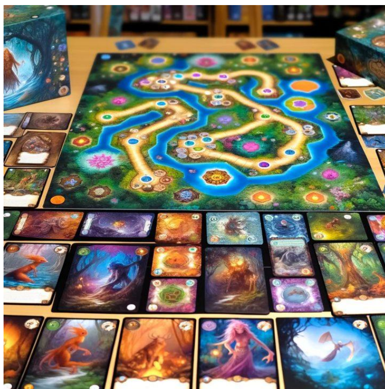
Рисунок 1.13 — Гра «Dixit»

зокрема завдяки виразним, сюрреалістичним ілюстраціям, що стали візуальним символом гри та посприяли її впізнаваності на глобальному ринку (рис. 1.13).