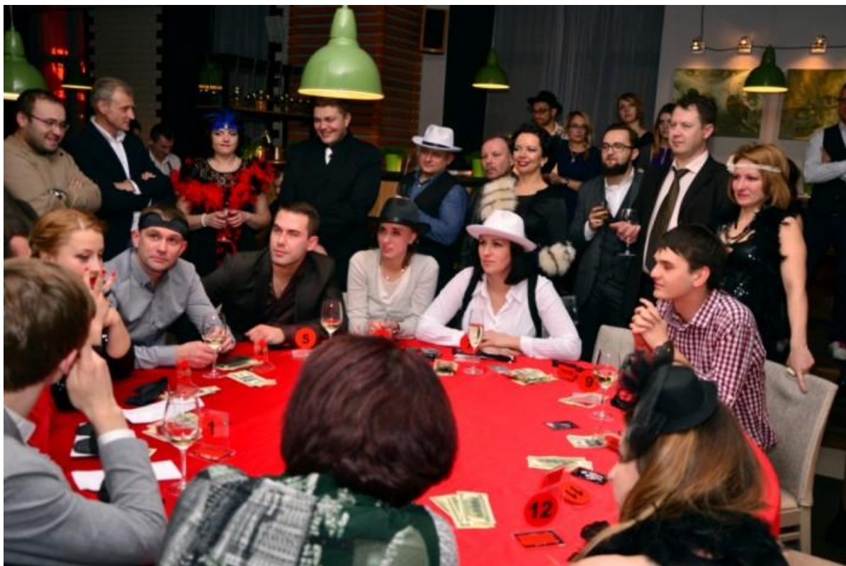
Рисунок 2.9 — Салон присвячений грі в «Мафія»

Гра «Мафія» неодноразово використовувалась як сюжетна основа у кінофільмах, зокрема в стрічках «Вовк-одинак» (2005) та «Гра у вбивство» (2006), що ще раз підкреслює її популярність і впізнаваність у сучасній культурі.