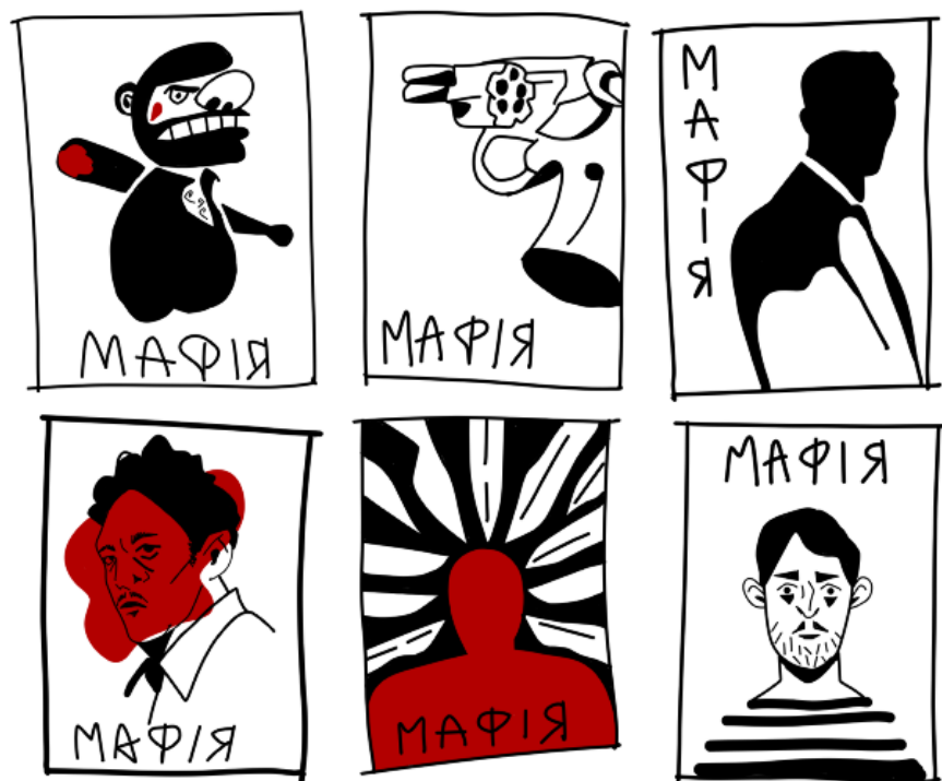
Рисунок 3.1 — Ескізи карток

На етапі первинного проектування було створено кілька концептуальних ескізів, що свідомо відрізнялися між собою за стилістикою, форматом зображення та виразними засобами (рис. 3.1). Такий підхід дозволив порівняльним шляхом визначити найефективніший напрямок візуального розвитку гри та обґрунтувати вибір стилю для основних елементів дизайну.