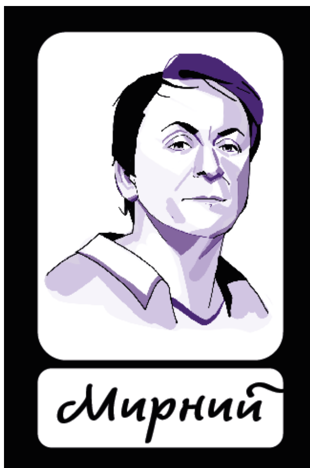
Рисунок 3.8 — Гральна карта

Таким чином, декоративний елемент не лише виконує естетичну функцію, а й поглиблює змістовий рівень ідентифікації ролей. Йі сама картка вийшла збалансованою й око падає на сам перед на важливу інформацію (надпис) та тільки після цього підіймається до ілюстрації (рис 3.8).