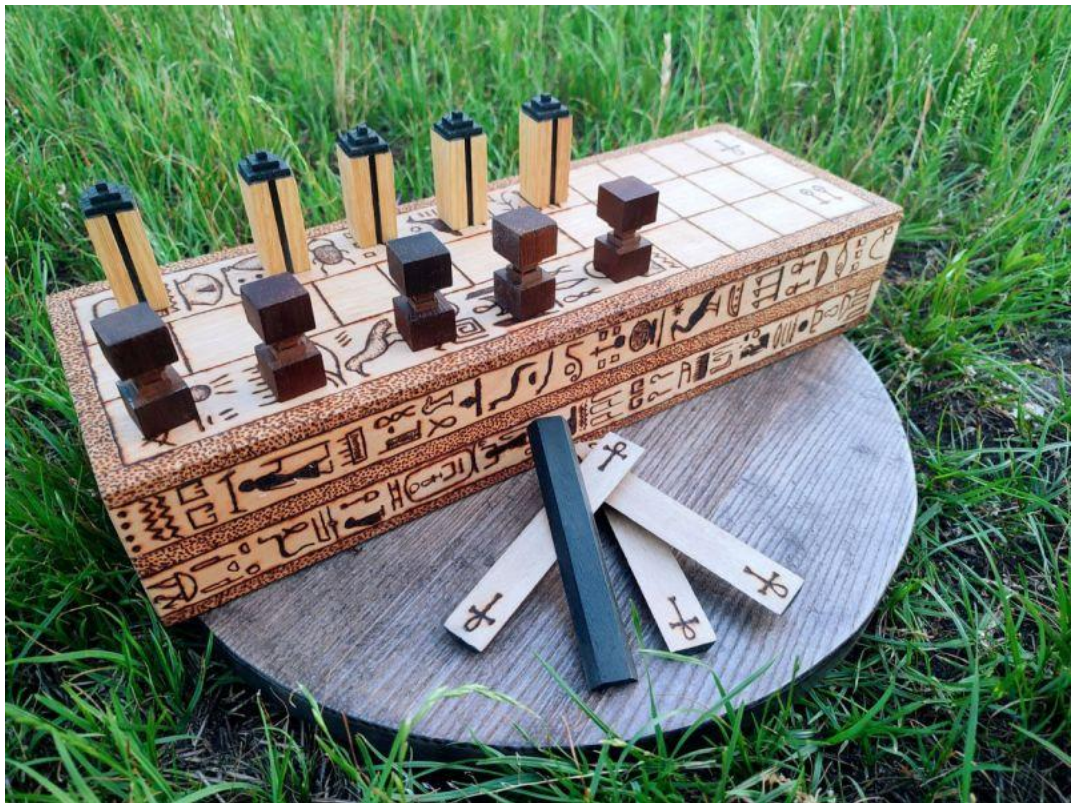
Рисунок 2.1 — Древня настільна гра «Сенет»

Настільні ігри мають глибоке історичне коріння та супроводжують людство впродовж тисячоліть. Їхня поява пов'язана не лише з розвагою, а й із релігійними обрядами, філософськими практиками, освітніми та соціальними функціями. Від найдавніших цивілізацій до сучасного світу настільні ігри трансформувалися від сакральних символічних дій до інструментів культурної комунікації та соціалізації. Однією з найдавніших ігор вважається «Сенет», що існував у Давньому Єгипті понад 5 тисяч років тому (рис. 2.1). Його ігровий процес був пов'язаний із релігійними уявленнями про загробне життя, а переміщення фігур на полі трактувалося як алегорія переходу душі через випробування потойбічного світу. Гра, таким чином, виконувала роль посередника між світом живих і божественним простором [4].