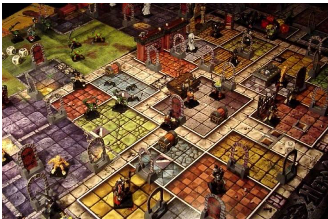
Рисунок 2.7 — Приклад набору для «Dungeons & Dragons»

У ХХ столітті настільні ігри еволюціонували від простих розваг до складних стратегічних систем. Вони почали охоплювати широку аудиторію, не обмежуючись дітьми. Такі ігри, як «Scrabble», «Бридж», «Покер», «UNO» [13], «Мафія», стали знаковими для своєї епохи. Особливу роль у 1970-х роках відіграла поява рольових ігор (RPG), зокрема «Dungeons & Dragons» [12], які вперше запропонували гравцям повну свободу у створенні персонажів та сюжетів (рис. 2.7).