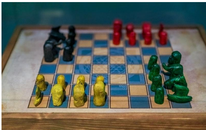
Рисунок 2.2 — Древня настільна гра «Чатуранга»

У Давній Індії з'явилася гра «Чатуранга», яка стала попередницею сучасних шахів (рис. 2.2). Вона не лише відображала стратегічне мислення, а й уособлювала соціальну структуру тогочасного суспільства, представляючи чотири основні касты: брахманів, кшатріїв, вайш'їв і шудр. Кожна фігура на полі відповідала певному соціальному прошарку, а динаміка гри ілюструвала взаємодію та баланс між ними.