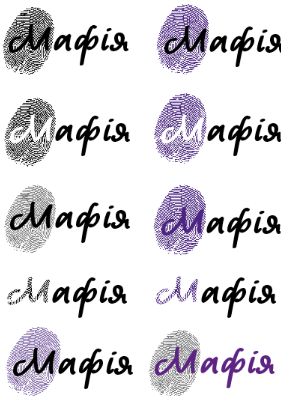
Рисунок 3.4. — Пошук розміщення декоративного елемента

Також були створені варіанти сорочок карток, що були опрацьовані в кількох стилістичних варіаціях для подальшого узгодження з загальним візуальним рядом гри (рис. 3.5). За основу був взятий логотип гри та різні варіації використання його цілком, або ж лише деяких елементів. Проте найкращим варіантом було обрано використання відбитку пальця та назви гри на чорному тлі з фіолетовими плямами щоб урізноманітнити зображення.