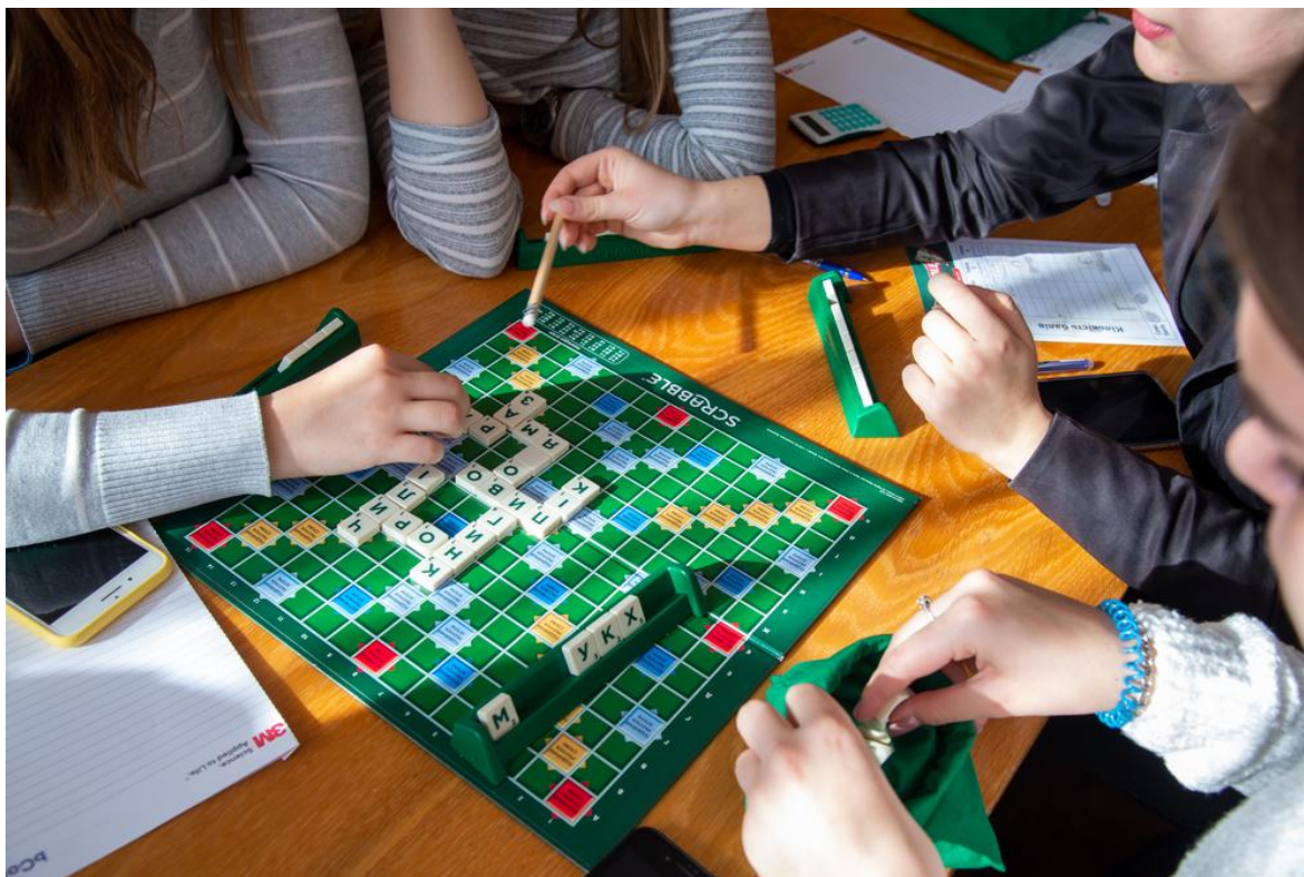
Рисунок 1.1 — Інтелектуальні настільні ігри

2. Ігри типу «ходилка» — переважно сімейні та дитячі ігри з ігровим полем, де учасники переміщуються фішками відповідно до випадкового результату (кубика) (рис. 1.2). Розважальні ходилки можуть бути засновані на сюжеті популярних мультфільмів, казок, дозволяють сім'ям приміряти на себе роль відважних мандрівників, улюблених анімаційних героїв. Сприяють розвитку дрібної моторики, уваги, а також сімейному дозвіллю. Мета — дістатися фінішу або виконати певне завдання на шляху. Основні характеристики: Простота правил, доступність навіть для дошкільнят, візуально яскраве оформлення поля з ілюстраціями, часто мають сюжетну основу (казки, пригоди, мультфільми, розвивають увагу, терплячість, координацію рухів. Приклади: