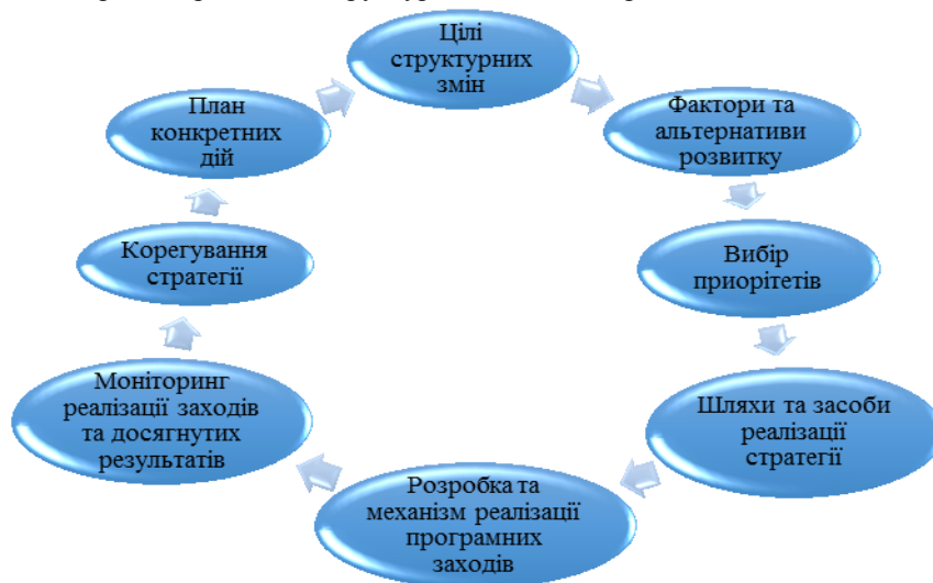
Рис. 4. Етапи формування структурної політики

Процес формування структурної політики в межах стратегічного планування здійснюється поетапно в певній послідовності (рис. 4). Тобто на першому етапі відбувається визначення цілей стратегічного планування в межах структурних перетворень визначених викликами глобального розвитку національної та світової економік. Далі проводиться аналіз факторів та формування стратегічних альтернатив, обґрунтування вибору та встановлення пріоритетів, на основі яких приймається стратегія та визначаються шляхи і засоби її реалізації. Для ефективного впровадження вибраної стратегії необхідно розробити програмні заходи, сформувати системи управління та механізм реалізації програмних заходів, проводити моніторинг реалізації заходів і досягнутих результатів та розробляти процедуру коригування стратегії. Як наслідок проведеної роботи відбувається розробка плану конкретних дій для урядових структур і органів державного управління в рамках реалізації структурної політики держави.