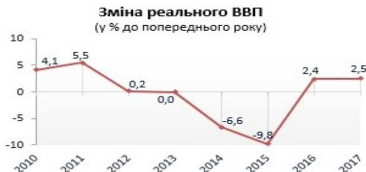
Рис. 3. Динаміка реального ВВП України [2]

Величина валового внутрішнього продукту, розрахованого за паритетом купівельної спроможності (ВВП за ПКС) на душу населення, скоротилася з 4 075 дол. у 2013 році до 1 562 дол. у 2016-му. У 2017 році за рівнем ВВП на душу населення Україна посіла 133 місце з показником 2205 доларів США, пропустивши вперед такі країни, як Мікронезію, Судан, Гондурас та інших економічних "тигрів". Поруч з нами – Папуа-Нова Гвінея, де рівень ВВП на душу населення майже дорівнює нашому і складає 2094 доларів [3].