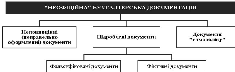
Рис. 1. Структура «неофіційної» бухгалтерської документації

Склад «неофіційної» бухгалтерської документації представлено на рис. 1.