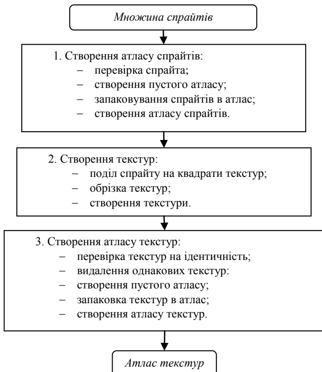
Рисунок 1 – Загальна схема інформаційної технології компоновки колекцій текстур у атласи зображень із компактифікацією

Блок «створення атласу текстур» – це блок перетворення вхідних текстур на атлас текстур і він складається з таких етапів: