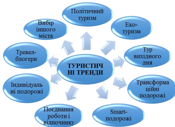
Рис.2. Туристичні тренди 2020 (складено автором за 5, 6, 7)

В останні десятиліття істотно зросла кількість людей, які обирають подорожі як вид відпочинку. Як зазначає тревел-гід Big Seven Travel, за останні десять років кількість мандрівників за рік пододало позначку в 1 млрд. осіб [5]. Виділяють ряд трендів, які визначатимуть уподобання туристів у 2020 та наступних роках (Рис.2).