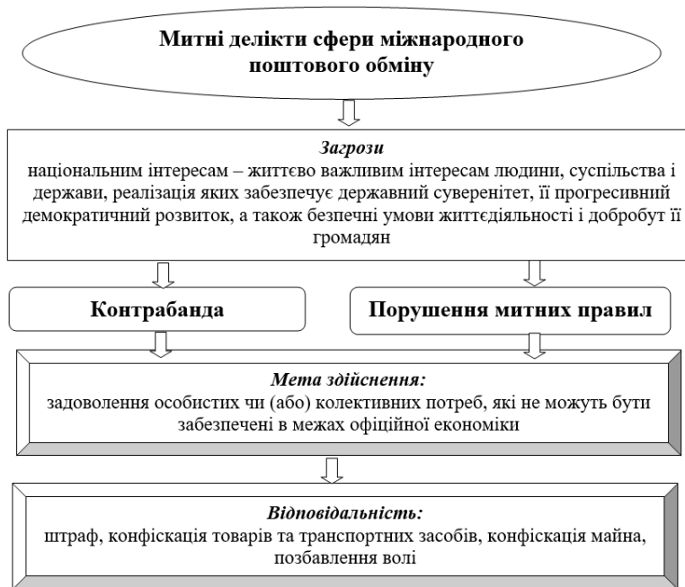
Рис. 2. Характеристика митних деліктів сфери МПВ та МЄВ