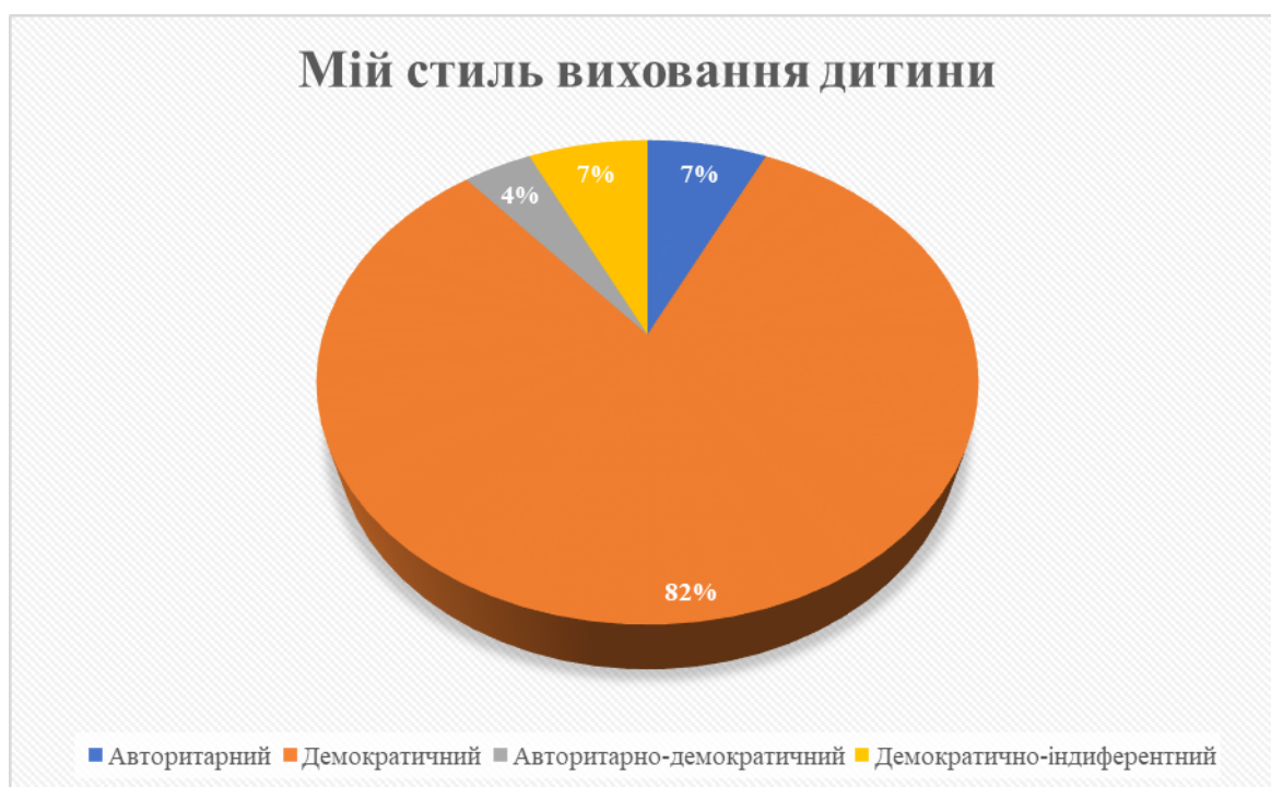
Рисунок 2.7 – Відповіді жінок щодо їх стилю виховання дітей (у %)

Проаналізувавши результати за цією методикою ми дослідили який стиль виховання жінки використовують або використовуватимуть до своїх дітей. Ми дослідили це за допомогою тесту «Мій стиль виховання дитини в сім'ї». Результати подано на рисунку 2.7.