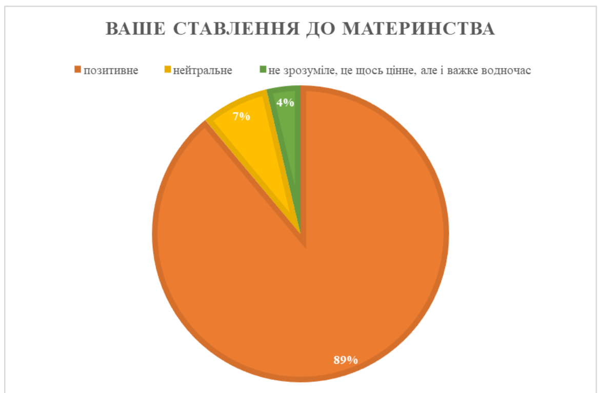
Рисунок 2.1 – Відповіді досліджених щодо їх ставлення до материнства (у %)

За результатами анкетування ставлення до материнства у досліджених є таким, як показано на рисунку 2.1.