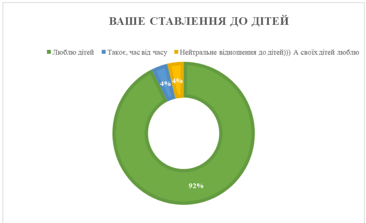
Рисунок 2.2 – Відповіді студенток щодо їх ставлення до дітей (у %)

Також ми запитали у жінок як вони ставляться до дітей. На що отримали наступні відповіді (рис. 2.2).