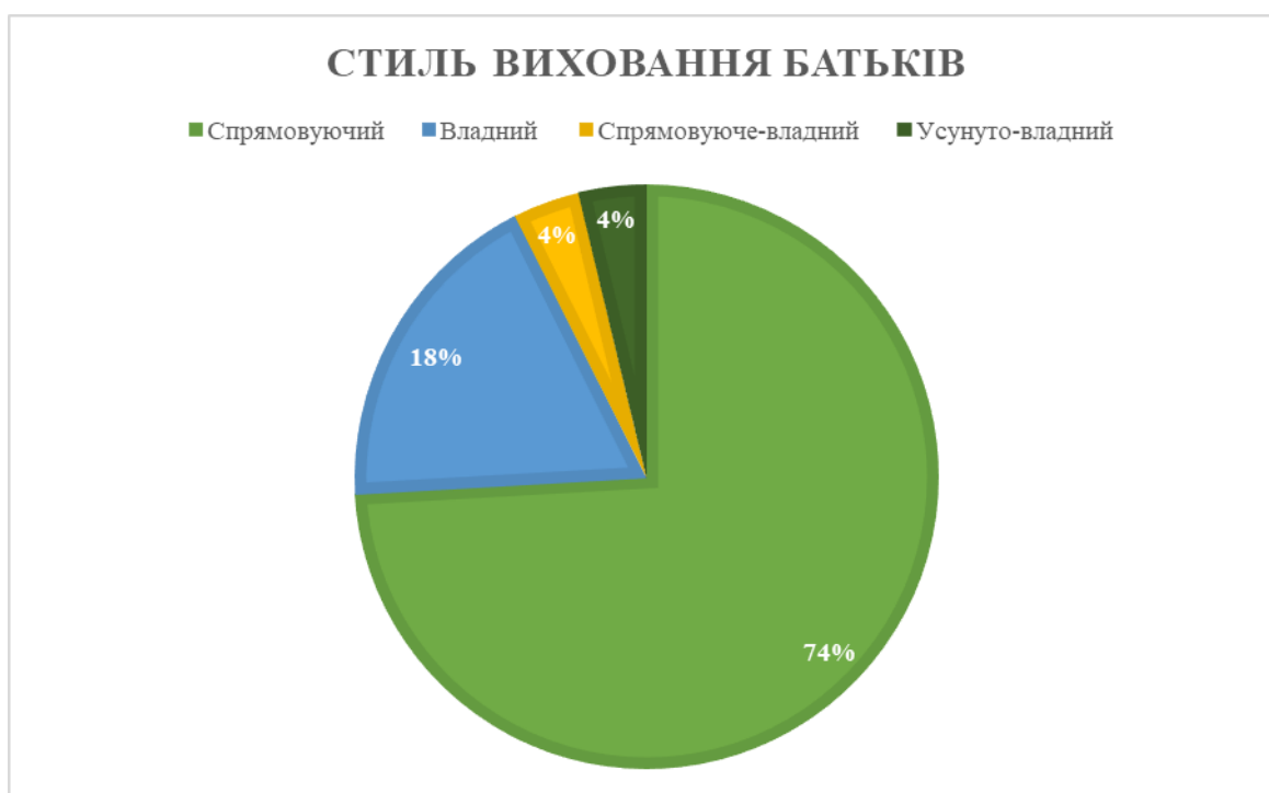
Рисунок 2.6 – Відповіді жінок щодо стилю виховання їхніх батьків (у %)

Також ми дослідили стиль виховання батьків жінок за допомогою анкети «Як вас виховували ваші батьки?». Результати дослідження подано на рисунку 2.6: