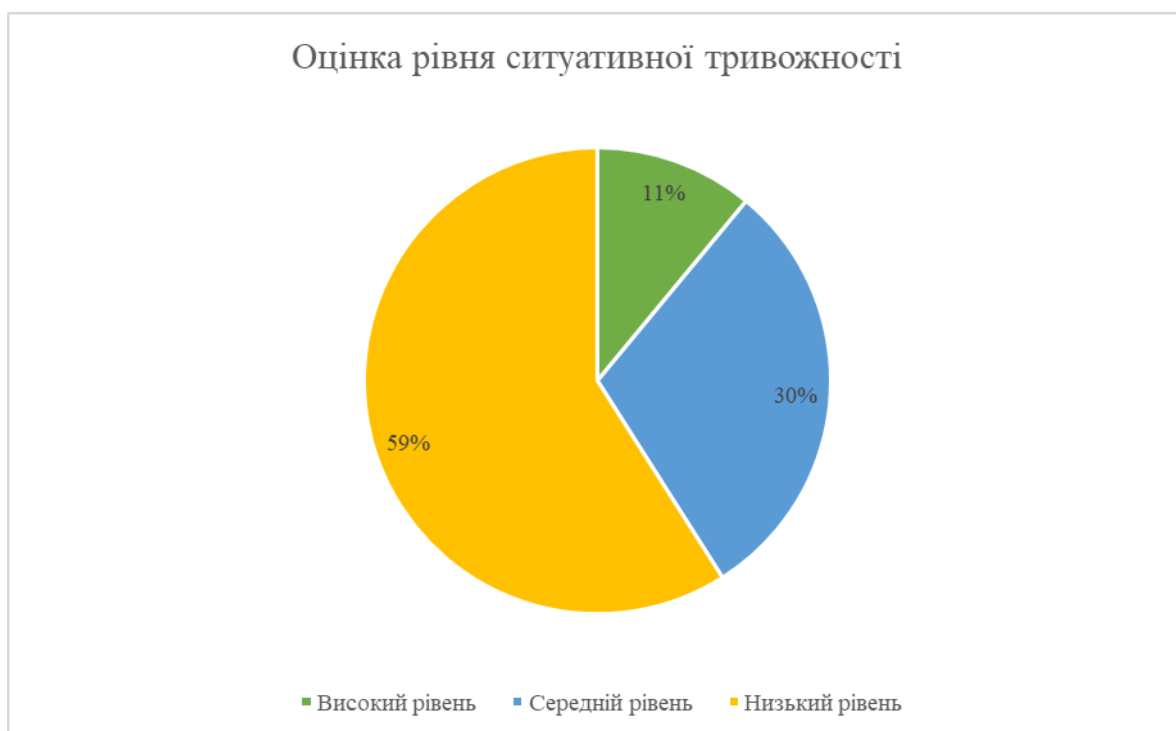
Рисунок 2.5 Результати дослідження, за методикою «Шкала реактивної і особистісної тривожності Спілберга» (у %)

Відповідно, розглянемо результати дослідження за методикою «Шкала реактивної і особистісної тривожності Спілберга» [45]. Цей тест виявив рівень ситуативної тривожності у жінок. Результати дослідження за цією представлені на рисунку 2.5: