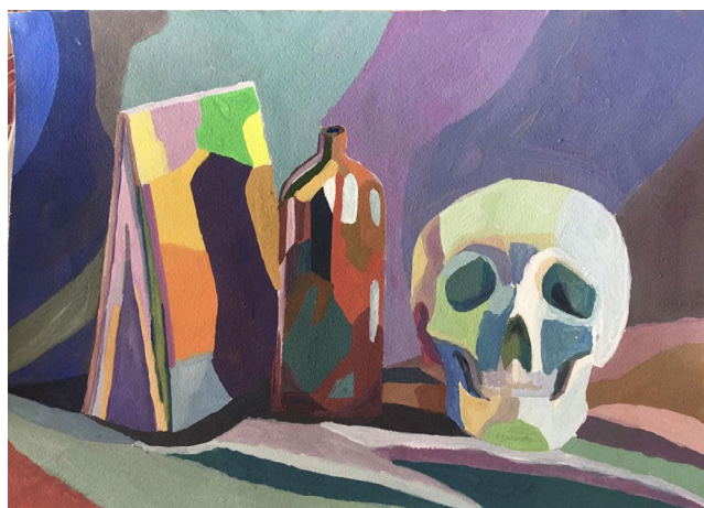
Рисунок 1. Живопис. Декоративне письмо натюрморту.