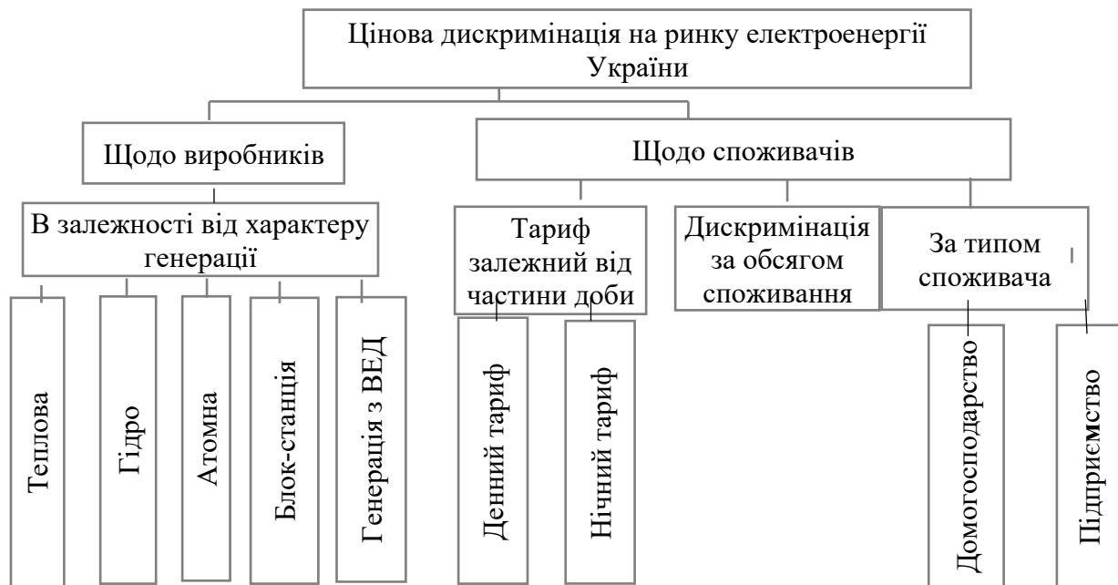
Рис. 1. Види цінової дискримінації на ринку електроенергії в Україні [складено автором]

Дискримінаційне ціноутворення на ринку електроенергії України представлено на рисунку 1.