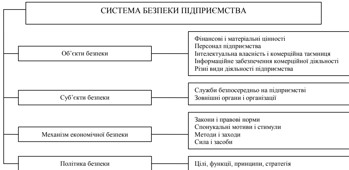
Рис. 1. Елементи системи забезпечення економічної безпеки підприємства

Формування механізму економічної безпеки засноване на визначенні економічних потреб в її забезпеченні, які формуються під впливом об'єктивних і суб'єктивних, внутрішніх і зовнішніх, прогнозованих і непрогнозованих чинників, які в концентрованому вигляді здійснюють деструктивний вплив. Беручи до уваги, що господарський механізм – це свідомо розроблений інструментарій управління, нами розроблена концептуальна схема формування механізму економічної безпеки підприємства, що представлена на рис. 2.