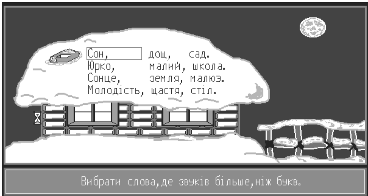
Рис.2.7 Педагогічний програмний засіб з української мови (2 клас)

Курсовий проект розробляється вже не на факультативах, а вводиться до варіативної складової навчального плану 10 та 11 класів. На курсовий проект виділяється певний термін зі своєю структурою. Причому один курсовий проект виконується групою з двох учнів, що дає змогу збільшити швидкість розробки програми та її складність. Це потребує більш широкої комп'ютеризації навчального процесу (вже підготовленні вчителі та учні, розроблена методика проведення комп'ютерно-орієнтованих уроків), що в свою чергу потребує більшої кількості різноманітних програм, а також підвищеного рівня їх складності. Як результат, дає змогу збільшити кількість навчальних програмних засобів, покращити їх якість, підвищити рівень знань учнів. В свою чергу, впровадження курсового проекту також підвищує рівень знань учнів, оскільки для написання програм необхідно глибоке знання з усіх тем.