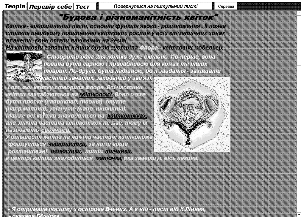
Рис. 3 Програма для супроводу навчання біології (мова програмування Delphi), студент групи ІТП 08-1