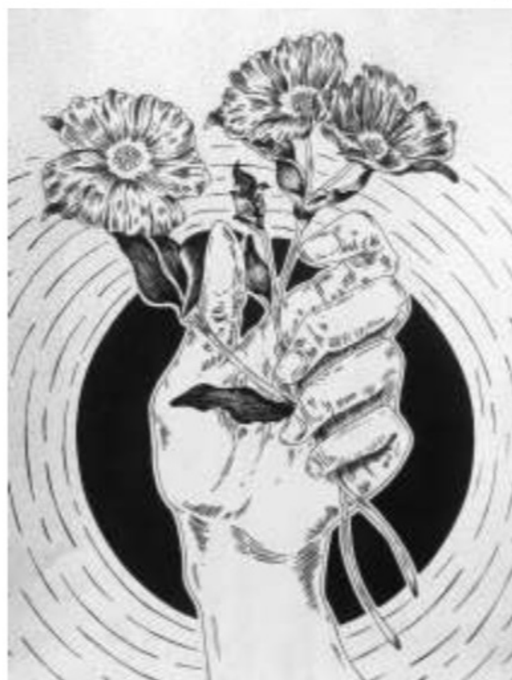
Рис. 3. Художньо-графічне узагальнення кисті руки.