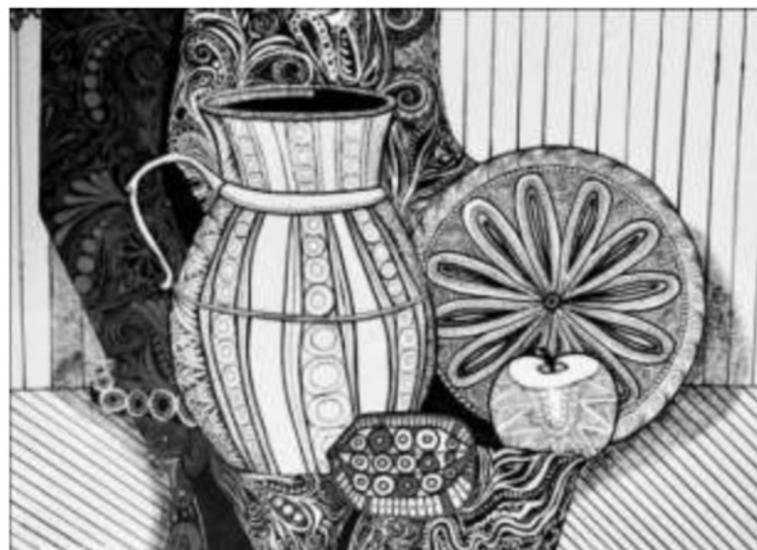
Рис.2. Художньо-графічне узагальнення натюрморту з предметів побуту.