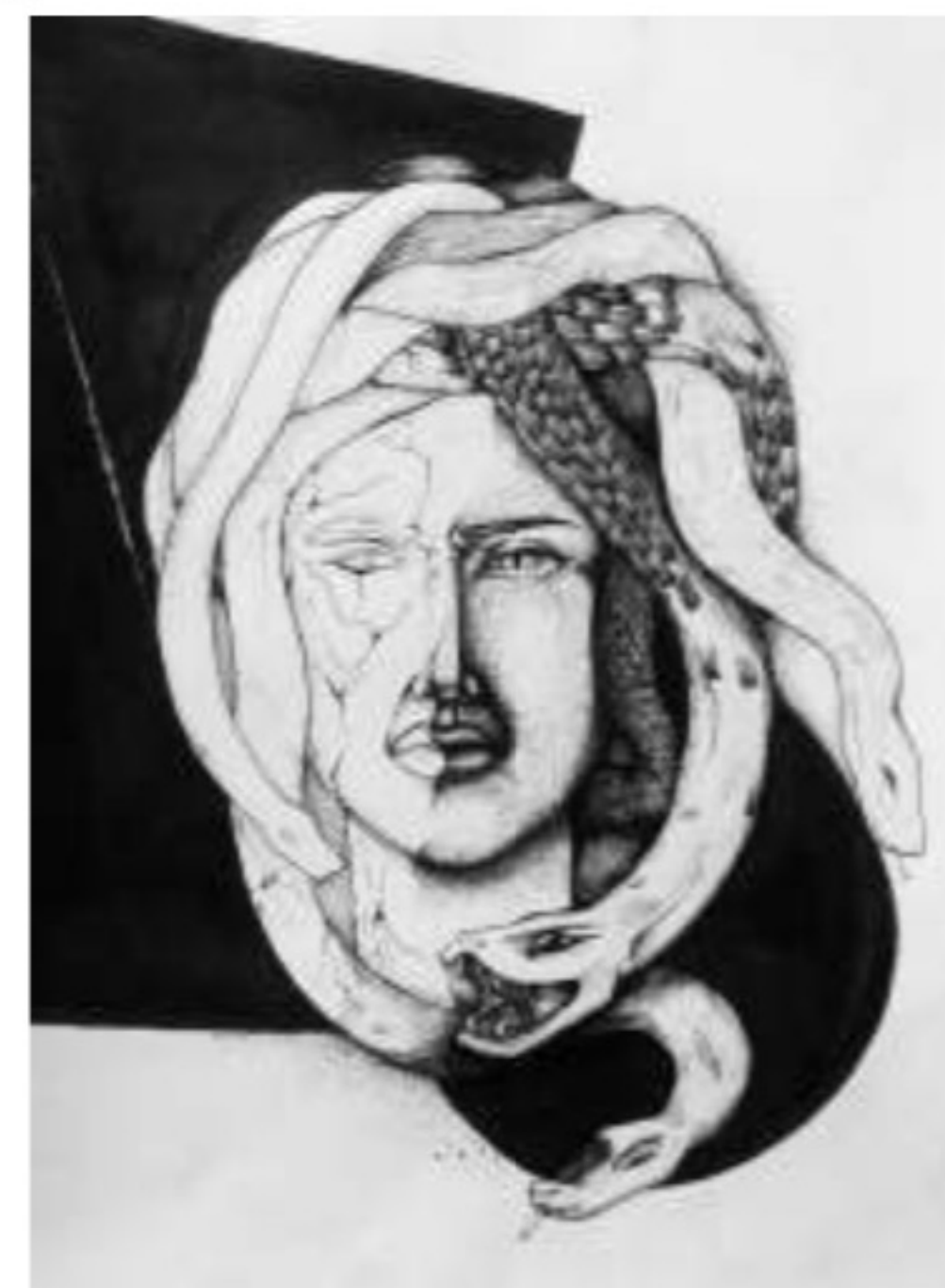
Рис. 4. Художньо-графічне узагальнення гіпсової жіночої голови.