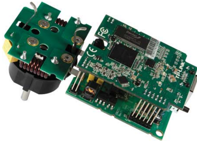
Рис. 2. Адаптер TP-LINK TL-PA551.

Усередині адаптера встановлені дві невеликі друковані плати, з'єднані між собою декількома контактними групами. На основній платі встановлено чіп Atheros AR7400-AC2C, що відноситься до четвертого покоління і забезпечує підтримку PowerLine-частини пристрою. Чіп на апаратному рівні підтримує модуляції OFDM 4096/1024/256/64/16/8 QAM, QPSK, BPSK і ROBO. В якості допоміжного чіпа використовується мікросхема Atheros AR1500. Оскільки новий стандарт передбачає передачу даних на швидкості 500 Мбіт / с, в цьому адаптері встановлений гігабітний мережевий контролер на базі мікросхеми Atheros AR8021. Оперативна пам'ять представлена мікросхемою Zentel A3S28D40FTP об'ємом 16 Мбайт. Крім цих основних елементів, на платах розташовані допоміжні фільтри та інші компоненти.