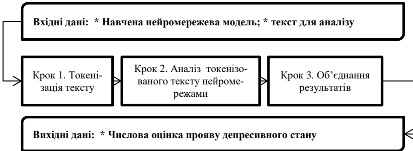
Рисунок 1 – Схема та кроки методу пов'язаного із навчанням у закладах освіти депресивного стану

якості моделі для синтаксичного аналізу користувацького тексту використовується модель BERT, а для семантичного – GPT2.