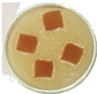
Рис. 4. Зразок, оброблений екстрактом лушпиння цибулі

Для зразків, оброблених екстрактами трави звіробою (рис. 2) та листків чаю (рис. 3), спостерігається зона затримки росту мікроорганізмів до 2 мм, що свідчить про їхню здатність проявляти антимікробну властивість незначною мірою.