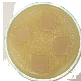
Рис. 5. Необроблений зразок

Таким чином, аналізуючи експериментальні дані по визначенню тангенціального опору матеріалів підкладки можна зробити висновок, що найкращим таким матеріалом є чистий бавовняний трикотаж різного переплетення. Його величина тангенціального опору є більшою, ніж в трикотажу з полієфіру та інших синтетичних ниток, і, як наслідок, більшими є сили тертя та зчеплення, які виникають при переміщенні однієї поверхні по іншій.