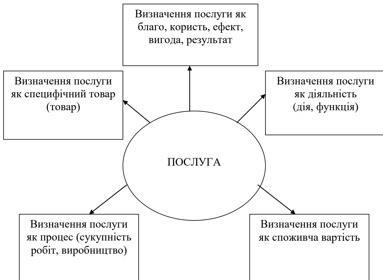
Рисунок 1.1 - Підходи до визначення поняття «послуга»