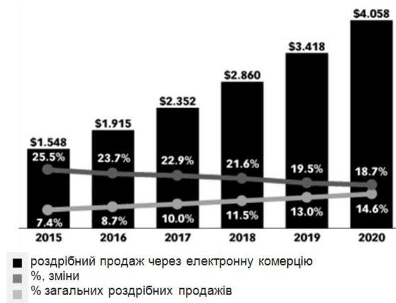
Рисунок 2 – Загальний обсяг роздрібних продажів через електронну комерцію у всьому світі, трлн дол. США

За прогнозами, азіатсько-тихоокеанський регіон залишатиметься найбільшим регіональним ринком у електронній комерції, досягнувши, за різними оцінками, обігу від 2,5 до 2,7 трильйона доларів до 2020 року.