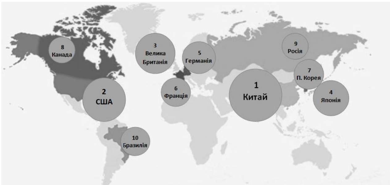
Рисунок 3 – Топ-10 ринків електронної комерції в світі

Центр інтернет-торгівлі в Європі – Великобританія. Обсяг онлайн-продажів у сфері B2C тут втричі вищий, ніж на другому за величиною ринку континенту – Німеччині. Провідний майданчик тут – Amazon, на який припадає 54% всіх продажів.