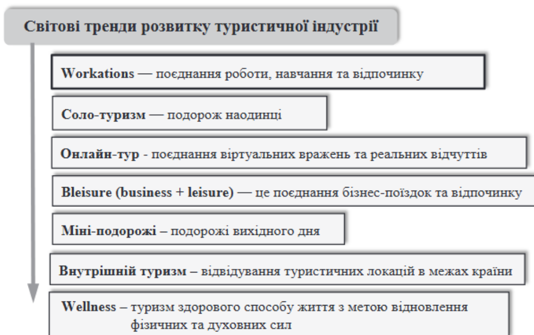
Рисунок 2.3 - Глобальні тенденції розвитку туристичної індустрії.

bleisure (business + leisure), яка передбачає поєднання ділових подорожей із відпочинком (рисунок 2.3).