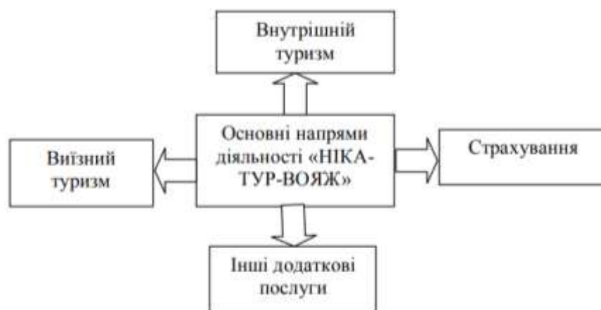
Рисунок 2.2 - Напрями діяльності туристичної агенції «Ніка-Тур-Вояж»