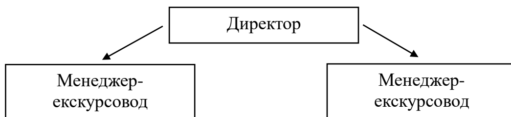
Рисунок 2.1 – Організаційна структура ТА «Ніка-Тур-Вояж»

ТА «Ніка-Тур-Вояж» працює на місцевому ринку і має невеликий персонал, який складається з власника фірми (також директора) та двох менеджерів-екскурсоводів. Організаційна структура компанії є лінійною (рисунок 2.1).