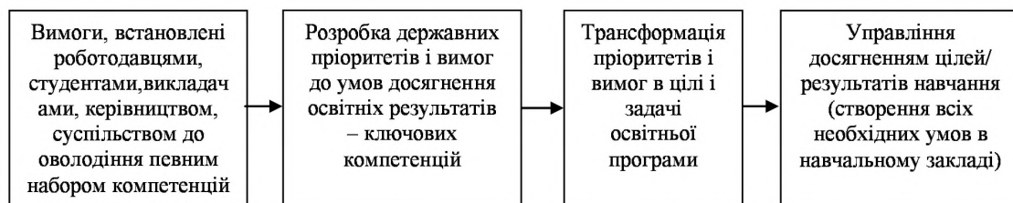
Рис.1. Схема „Система управління якістю освіти”

Оволодіння компетенціями є основною метою і результатом процесу навчання, управління досягненням яких в навчальному процесі і визначає його ефективність, а саме якість освіти (рис.1).