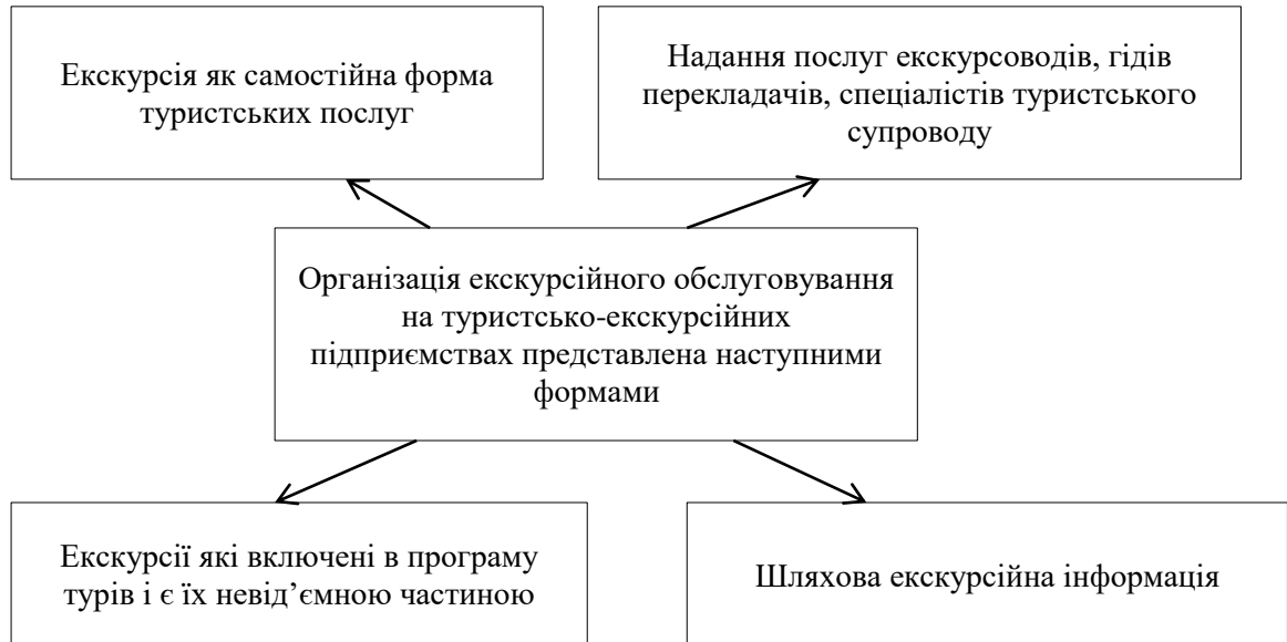
Рисунок 1.2 – Форми організації екскурсійного обслуговування на туристсько-екскурсійних підприємствах

– для певної групи екскурсантів (формується на підставі врахування вимог диференційованого підходу до обслуговування окремих груп екскурсантів) [22].