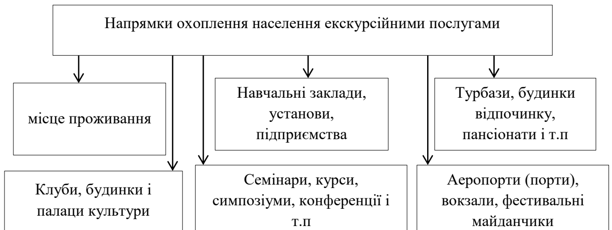
Рисунок 1.1 - Напрямки охоплення населення екскурсійними послугами

Організація будь-якої форми екскурсійного обслуговування складається з кількох цілеспрямованих дій, спрямованих на задоволення бажань і потреб туристів. Цільова робота з надання туристичних пропозицій цільовому населенню здійснюється за напрямком, який зображено на рисунку 1.1.