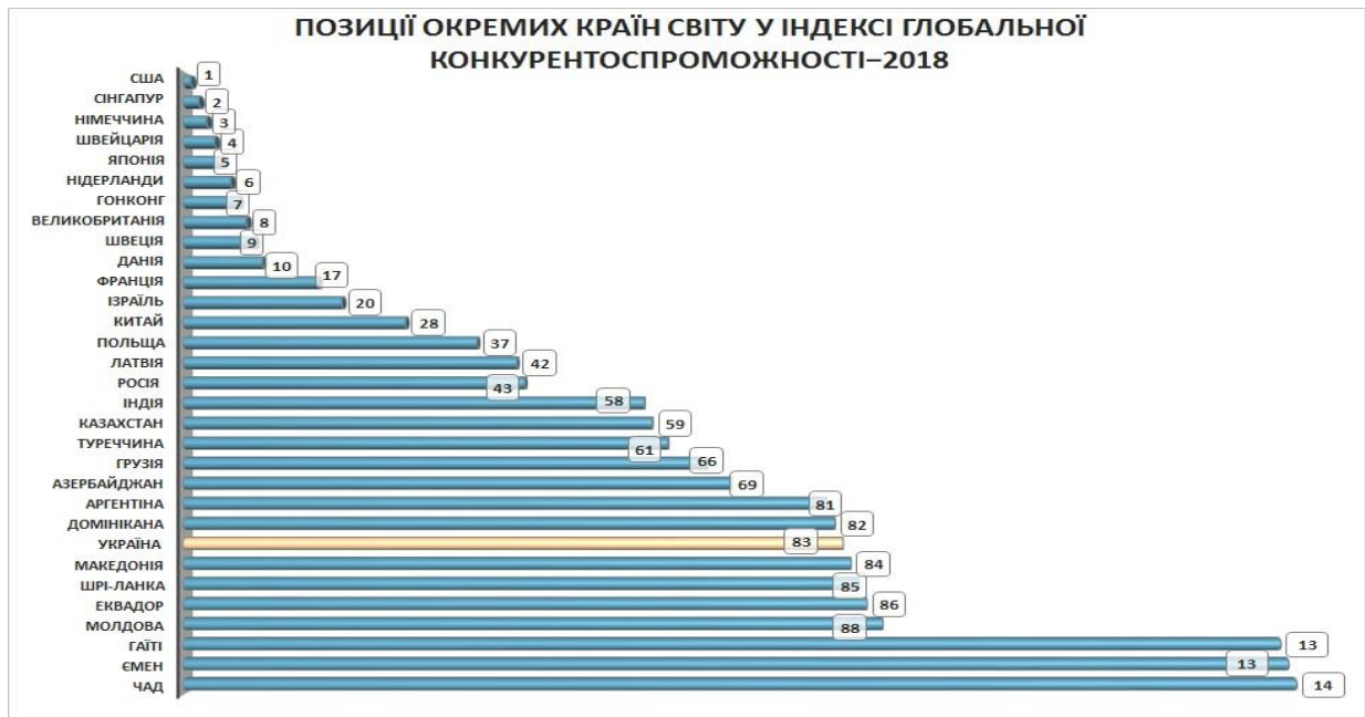
Рис. 4 – Позиції країн світу за індексом глобальної конкурентоспроможності 4.0 у 2018 році [6]

Сінгапур, Німеччина, Швейцарія, Японія, Нідерланди, Гонконг, Великобританія, Швеція і Данія. Польща знаходиться на 37 місці, Словаччина - 41, Росія – на 43, Угорщина - 48, Румунія - 52, Туреччина - 61, Грузія – 66, Молдова - 88. Україна посіла 83 місце - у неї слабо розвинені інститути, вкрай нестійкі фінансова система і макроекономічні показники (Рис.4).