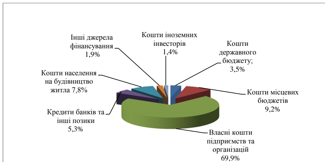
Рис. 3 - Розподіл капітальних інвестицій за джерелами фінансування, % [3]

Головним джерелом фінансування капітальних інвестицій, як і раніше, виступають власні кошти підприємств та організацій, за рахунок яких у 2017 році освоєно 69,9 відсотка капіталовкладень. Частка кредитів банків та інших позик у загальних обсягах капіталовкладень становила 5,3 відсотка. За рахунок державного та місцевих бюджетів освоєно 12,7 відсотка капітальних інвестицій. Частка коштів іноземних інвесторів становила 1,4 відсотка усіх капіталовкладень, частка коштів населення на будівництво житла – 7,8 відсотка. Інші джерела фінансування становлять 2,9 відсотка (рис.3) [3].