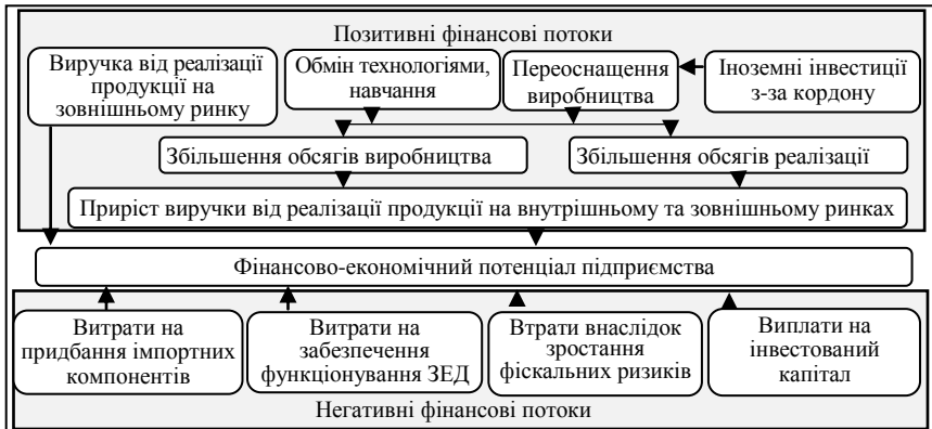
Рис. 1. Генерування фінансових потоків від зовнішньоекономічної діяльності підприємств

Обґрунтовано залежність системи управління ЗЕД від характеристик самого підприємства та від його зовнішньоекономічної діяльності. Уточнено перелік особливостей ЗЕД як об'єкту управління, які стосуються суб'єктів управління, території здійснення, інструментів і особливостей регулювання, рівня невизначеності та деталізовано принципи системи управління, на яких вона має базуватись. Запропоновано послідовність формування системи управління ЗЕД з врахуванням вимог до її адаптивності та спрямованості на досягнення цілей підприємства, у тому числі на забезпечення розширеного відтворення його фінансово-економічного потенціалу. Визначено фактори, які потрібно враховувати при виборі системи управління ЗЕД на підприємства.