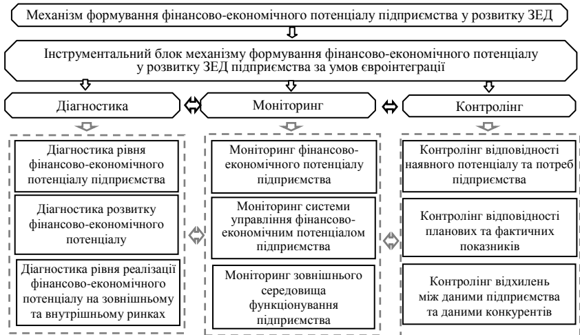
Рис. 4. Структура інструментального блоку механізму формування фінансово-економічного потенціалу у розвитку ЗЕД підприємства

Діагностика рівня фінансово-економічного потенціалу в побудованому механізмі передбачає оцінку наявних ресурсів і здатностей у підприємства у певний проміжок часу. Під здатностями пропонуємо розуміти необхідні в певний проміжок часу характеристики фінансово-економічного потенціалу підприємства, які створюють додаткові переваги для нього на ринку. Діагностика рівня реалізації фінансово-економічного потенціалу передбачає аналіз та оцінку результатів його використання, у тому числі у контексті застосування можливостей, що виникають у зовнішньому середовищі.