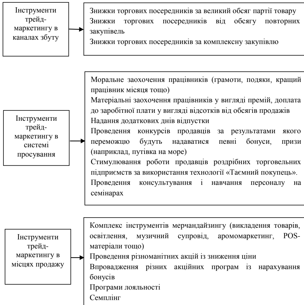
Рисунок 2 – Інструменти трейд-маркетингу залежно від місця впровадження

До групи інструментів трейд-маркетингу із стимулювання збуту за допомогою встановлення знижок відносяться: індивідуальні умови надання знижок певним групам споживачів, наприклад, студентам, пенсіонерам, постійним клієнтам тощо; знижки за одночасну купівлю або визначеної кількості товарів або товарів на певну суму; знижки за досягнення поставленого плану продажів; сезонні або позасезонні знижки; знижки за продаж нового товару; знижки за комплексну закупівлю.