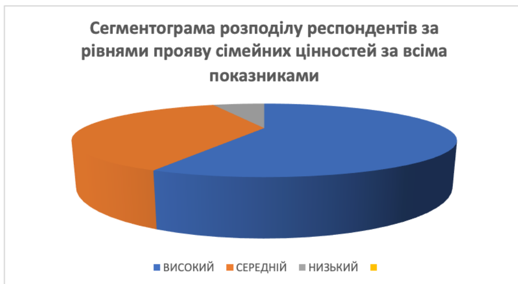
Рис. 2.1 – Сегментограма розподілу респондентів за рівнями прояву сімейних цінностей за всіма показниками

Сумуючи кількість балів, отриманих за кожною характеристикою було виявлено загальну кількість, які мають той чи інший рівень прояву сімейних цінностей (рис. 2.1).