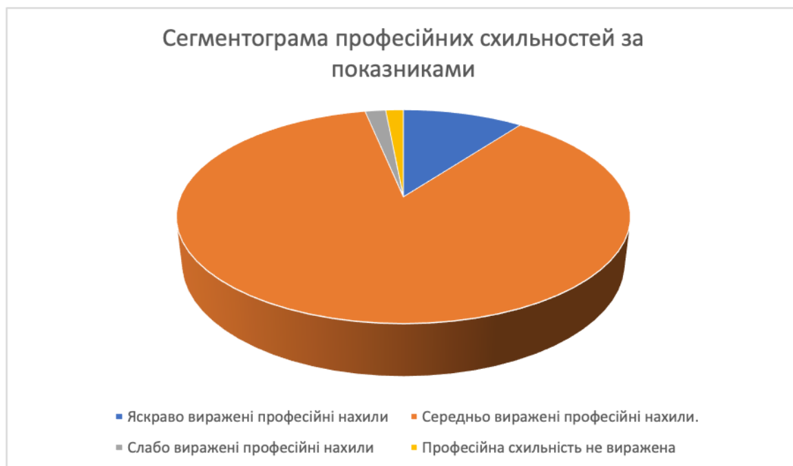
Рис. 2.2 – Сегментограма професійних схильностей за показниками

За результатами проведеного дослідження нами було виявлено, що найбільший відсоток у підлітків це професійні нахили середньо виражені (69,1%) а певний вид діяльності переважає схильність до роботи з людьми (52,2%), схильність до дослідницької діяльності (13,3%), схильність до роботи на виробництві (4%), схильність до естетичних видів діяльності (9,2%), схильність до екстремальних видів діяльності (2,1%), схильність до планово-економічних видів діяльності (19,2%).