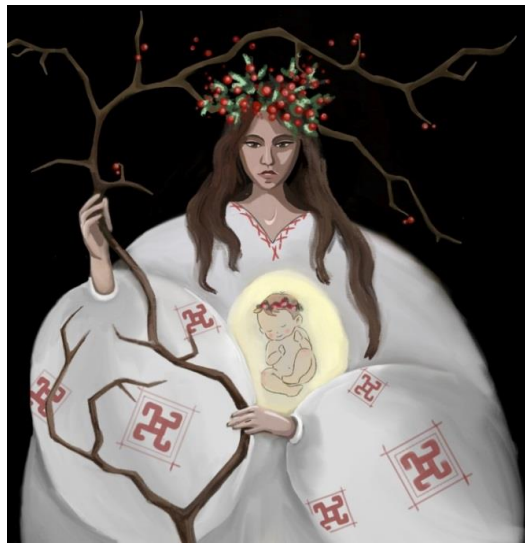
Рис. 1. Художній проєкт декоративної композиції «Берегиня»

З різних джерел відомі назви Берегині: Жива, Дана, Лада, Леля, Діва, Літня Баба, Рожаниця, Мокоша. З X ст., тобто з приходом християнства, символічне зна-чення Берегині (Венери, Рожаниці) було перекладено на образ Богородиці, Оранти, яку також зображають із піднятими до неба руками, немов старовинну Берегиню... В образі Оранти людина вшановувала саму природу, вшановувала життя, подвиг материнства. Отже, символ Берегині – це священний для нас, українців, генетичний код, який несе в світі суть і творення, і захисту, а через це – вічне оновлення і гармонію життя Людини [1-3].