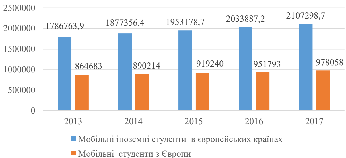
Рис. 3. Динаміка мобільності студентів в країнах Європи [2]

У європейських країнах тенденції мобільності студентів протилежні тенденціям в Україні (див. рис. 3). Академічна мобільність студентів в країнах-лідерах має організований характер на рівні державної політики, про це свідчить аналіз статистичних даних.