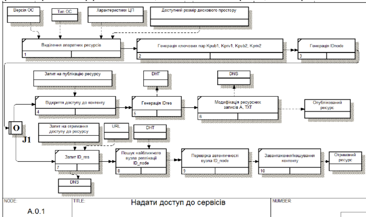
Рис. 4. Метод надання доступу до сервісів розподіленої хмарної системи

Описані процеси додавання нового вузла, валідації автентичності, публікації ресурсу й отримання доступу до ресурсу подано у вигляді поетапної послідовності дій у межах методу надання доступу до сервісів розподіленої хмарної системи за допомогою графічного опису інформаційних потоків, взаємодії процесів оброблення інформації та об'єктів, які є частиною цих процесів, IDEF3 на рис. 4.