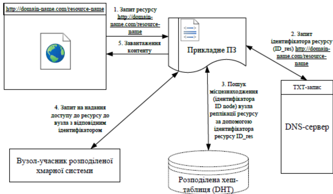
Рис. 3. Схема процесу надання доступу до ресурсів

Перевірка цілісності ресурсу та ідентичність реплік проводиться шляхом обчислення хеш-функції отриманого ресурсу і зіставлення зі значенням ідентифікатора цього ресурсу. Крім того, на проміжному етапі перед завантаженням контенту виробляється процес валідації вузла, що надає ресурс.