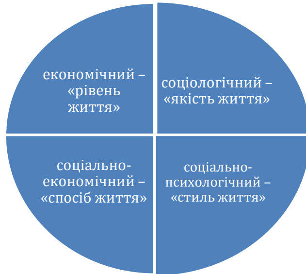
Рисунок 1.2 – Категорії способу життя

Як свідчать наукові джерела, здоровий спосіб життя – це не просто все те, що позитивно впливає на здоров'я людей. У даному випадку мова йде про всі компоненти різних видів діяльності, спрямованих на охорону і покращення здоров'я [12; 31; 36; 39; 40]. Дослідники вказують на те, що поняття здорового способу життя не зводиться до окремих форм медико-соціальної активності (викорінюванню шкідливих звичок, проходженню гігієнічних норм і правил, санітарної освіти, зверненню за лікуванням чи порадою в медичні заклади, дотриманню режимів праці, відпочинку, харчування тощо).