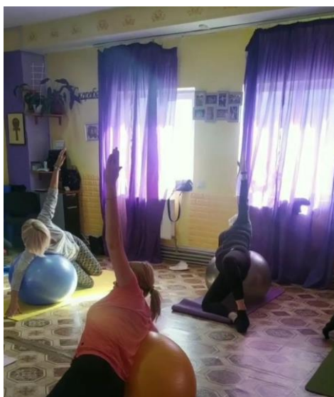
Фото із одного з занять оздоровчою гімнастикою