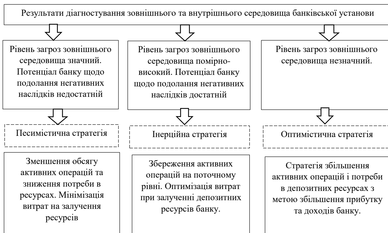
Рисунок 1.2 – Вибір оптимальної стратегічної альтернативи депозитної політики на основі аналізу зовнішнього та внутрішнього середовища банку