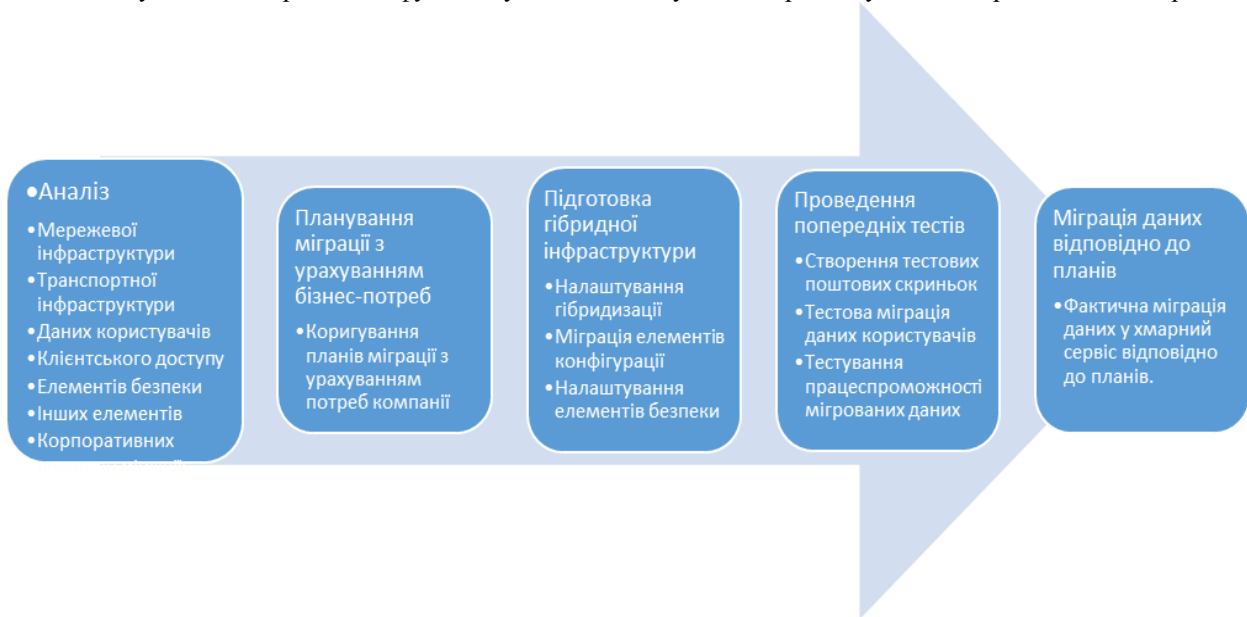
Рис. 1. Модель ведення проектів в рамках міграційної діяльності

Як прийнято в ІТ-проектах, пов'язаних з міграцією даних, інфраструктура, яку необхідно мігрувати, спочатку оцінюється з точки зору розміру даних і конфігурації системи, після цього виконується аналіз отриманих даних і планування їх передачі в хмарну інфраструктуру. Наступним етапом є практична міграція даних і тестування на коректність функціонування налаштувань хмарної служби, що представлено на рис. 1.