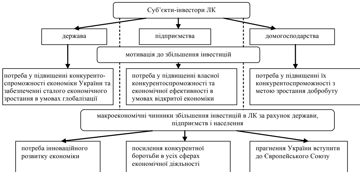
Рис. 2. Характеристика суб'єктів, мотивації та економічних чинників інвестування людського капіталу

Для того, щоб забезпечити значний приріст людського капіталу України, інвестиції у нього мають бути збільшені в декілька разів. В першу чергу, це стосується витрат підприємств та домогосподарств, частка яких у загальних інвестиціях у людський капітал повинна суттєво зрости (рис. 2).