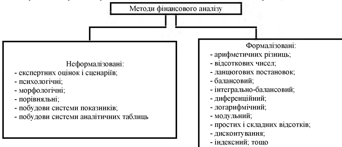
Рис. 1. Методи аналізу фінансового стану підприємства

Існують різні класифікації методів аналізу фінансового стану. За однією з них виділяють неформалізовані і формалізовані методи аналізу. Перші засновані на описі аналітичних процедур на логічному рівні, а не на чітких аналітичних залежностях. Їх застосування характеризується певним суб'єктивізмом, оскільки тут на перший план висуваються інтуїція, досвід і знання аналітика. До другої групи належать методи, в основі яких лежать формалізовані аналітичні залежності. (рис. 1).