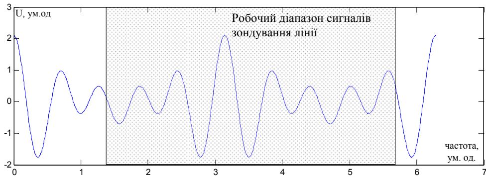
Рис. 3. Сумарний сигнал для сигналів рис.2 (сигнал виду 0,5 \cos(6\varphi) + 0,7 \cos(8\varphi) + 0,9 \cos(10\varphi) для діапазону \varphi = 0..2\pi )

Сумарний сигнал для рис. 2 представлено на рис. 3.