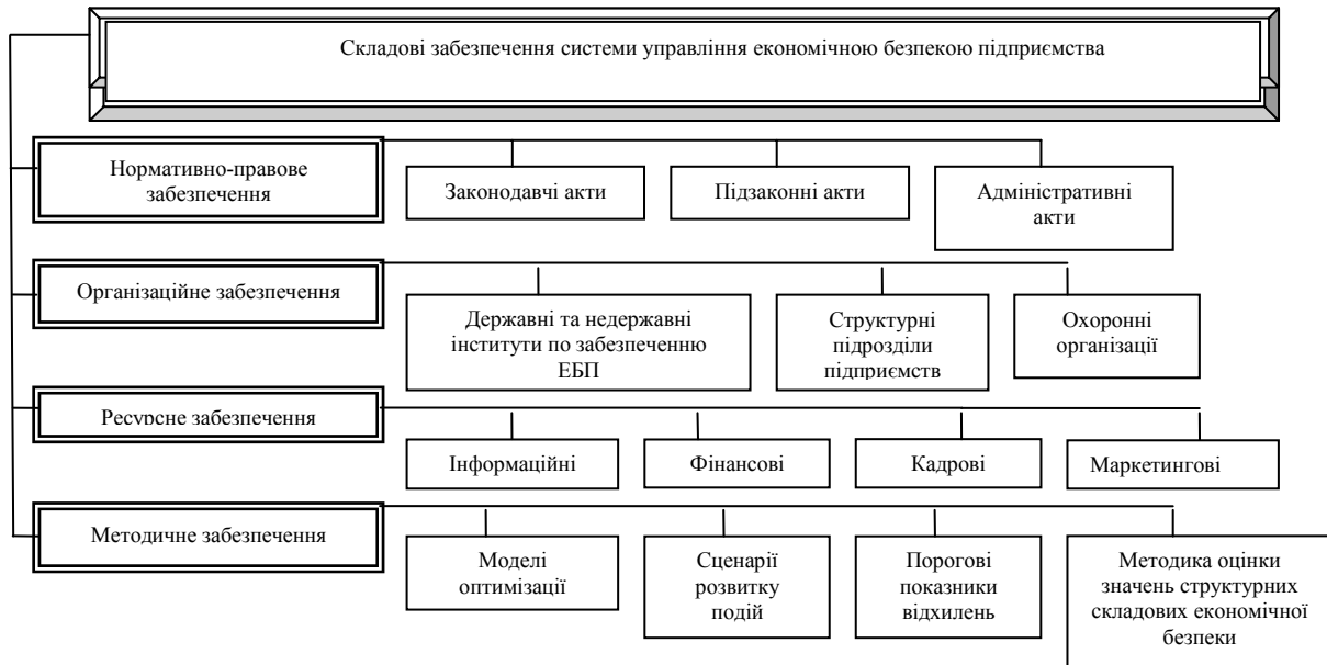
Рис. 2. Складові забезпечення системи управління економічною безпекою підприємства

Ефективне функціонування системи управління економічною безпекою підприємства вимагає відповідного забезпечення: нормативно-правового, методичного, організаційного, інформаційного, ресурсного (рис.2). Метою залучення ресурсів управління є здійснення превентивних заходів і запобігання збиткам від настання деструктивних подій.