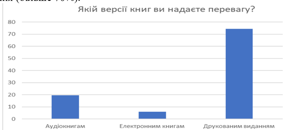
Рис. 2. «Книга і бібліотека в житті сучасного студента» (2020 р.)

Досить цікавим та неочікуваним виявилися результати порівняння думок респондентів щодо друкованих та електронних джерел художньої літератури у 2009 та 2020 рр. Якщо у 2009 р. до електронних видань зверталось 39,2% опитаних, то у 2020 надали перевагу електронним книгам лише 6%, аудіокнигам – 19,5%. Загалом про збереження інтересу до друкованих видань художньої літератури у 2020 р. заявили 74,4% респондентів (рис. 2). Електронні джерела студенти обирають загалом для навчання (більше 70%).