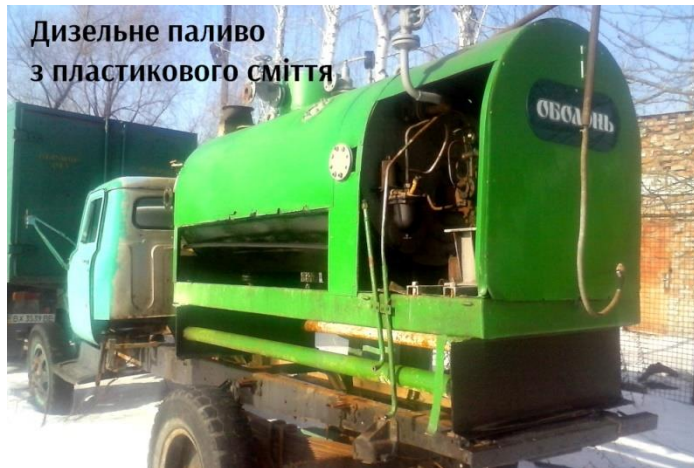
Рис. 1 Мобільна установка переробки пластикових пляшок у дизельне паливо компанії «Оболонь Ойл»

Серед основних причин, що спонукають вчених всього світу до таких досліджень є зменшення викидів парникових газів завдяки вдосконаленню методів виробництва електроенергії [1, 5]; забезпечення можливості електроживлення віддалених регіонів з урахуванням економічних (пов'язаних із вартістю дизельного палива) аспектів, надійності та забруднення навколишнього середовища [4-6]; забезпечення електроенергією сільських районів слаборозвинених країн [7]; надійне джерело енергії групи швидкого реагування у віддалених місцях стихійного лиха для живлення вакцинного холодильника, системи очищення води та базової системи супутникового зв'язку [8], що має великий потенціал для порятунку людських життів.