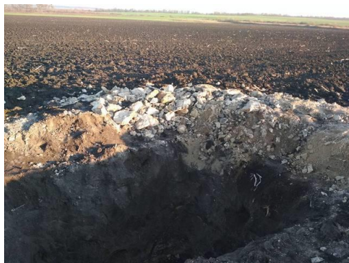
Фото 2. Пограбований курган між селами Ставниця та Шрубків колишнього Летичівського району Хмельницької області. Фото С. Шпаковського.

У жовтні 2018 р. неподалік Меджибожа, між селами Шрубків та Ставниця, що в колишньому Летичівському районі, скарбощукачі зруйнували та пограбували древній курган. Грабіжницький розкоп має не менше 6 метрів вглиб, розрито поховальну камеру, знайдено фрагменти кераміки, простежується культурний шар на глибину 1,5 м, зафіксовано залишки обпеченої глини, каміння, яким було викладено поховальну камеру (Фото 2.). Попередньо за структурою та округлою формою дослідники відносять цей насип до скіфських часів.