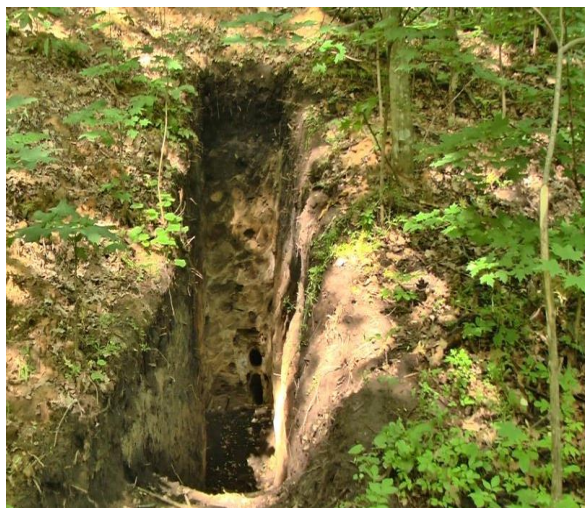
Фото 4. Грабійницький лаз скарбошукачів на кургані ранньоскіфського часу між селами Стуфчинці і Шпичинці Хмельницького району.

Насип округлої форми, розташований в лісі, розміром 40 x 40 м за 50 м від дороги із твердим покриттям. Розміри кургану говорять про його певну елітарність. Тобто тут поховано людину з досить високим соціальним статусом, ймовірно, знатного скіфського воєначальника 319 .