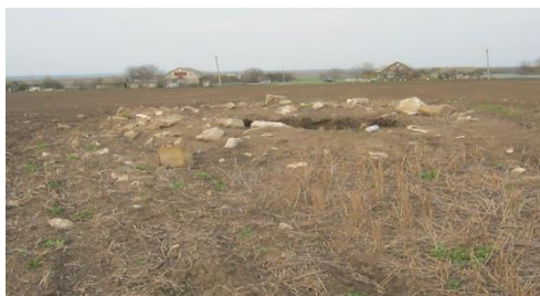
Фото 3. Пограбований курган ранньозалізного віку в с. Соколівка колишнього Ярмолинецького району Хмельницької області.

Курган має пам'яткоохоронний статус та внесений до переліку об'єктів археології. Також документально визначено його межі на місцевості. Дослідники відносять насип до Західноподільської курганної групи. Автор публікації зафіксував наступні розміри: курган округлої форми, розташований на рівному полі, із південно-західної сторони розміщені житлові будівлі, 1,2 м висоти, 20 м в діаметрі, його поли – підорано. Для будівництва використано камінь-вапняк, що характерно для курганів та курганних груп Західноподільської курганної групи. Зверху кам'яну крєпіду засипано землею. В середині насипу на глибині 1,5 м виявлено поховальну камеру, де знайдено фрагменти горілої глини жовто-гарячого кольору, уламки керамічних виробів ранньозалізного віку та останки кальцинованих людських кісток, що свідчить про здійснення поховального обряду кремації покійника. У будівництві існувала локальна система, що відповідала світогляду конкретних людей, які мешкали на цій території. Дослідники відносять насип до III тис. до н.е. та вважають, що тут поховано одного із представників скіфської еліти.