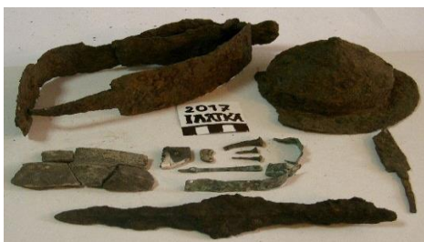
Фото 1. Комплекс речей та озброєння, виявлені у похованні пшеворської культури поблизу с. Лятка.

досліджено поховання воїна пшеворської культури (I-III ст. н.е.). Чорні копачі виявили його та засипали після вилучення артефактів. Поховання – найсхідніша на території України пам'ятка цієї культури з-поміж відомих нині. У напівсферичній оковці щита на метровій глибині були перепалені кістки, кінців'я ремня, фрагмент ножа, оків'я якогось предмета, обламаний цвях-вухналь і шматок посудини. Зверху – вістря списа та зігнутий у кілька обертів меч (фото 1.). Артефакти зараховують до пшеворської культури I-III ст. н.е., що поширювалася на території сьогоденних Польщі та Західної України.