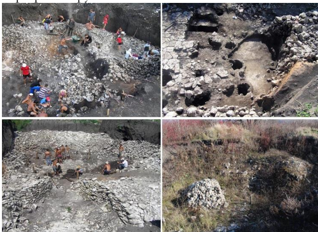
Фото 5. Археологічні дослідження Іванковецького кургану експедицією Кам'янець-Подільського національного університету імені Івана Огієнка під керівництвом А. Гуцала.

гробниці прилягав невеликий курган (висота – 1,9 м, діаметр – близько 4,3 м), перекритий ґрунтовим насипом.