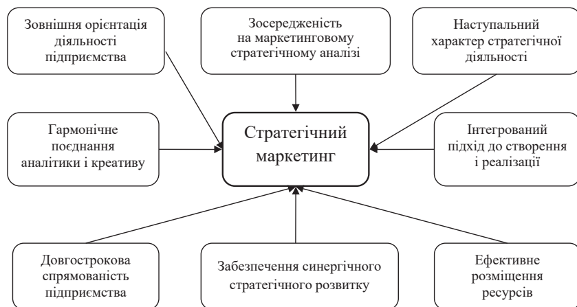
Рис. 1.2. Принципи стратегічного маркетингу

Також можна розглянути основні принципи стратегічного маркетингу підприємства, які подано на рис. 1.2.