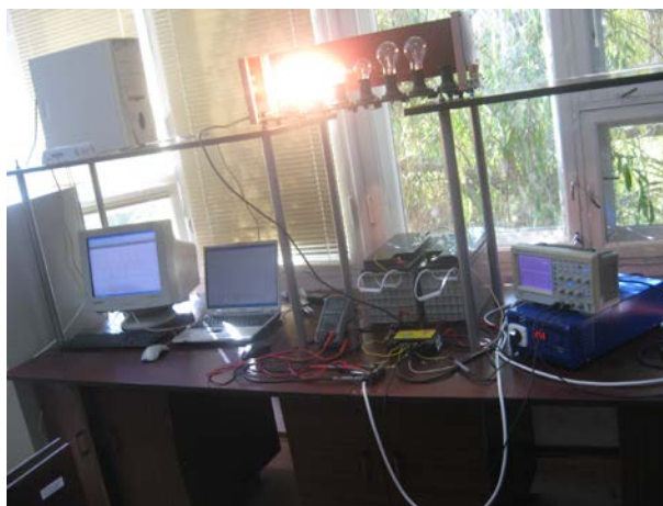
Рис. 4. Вузол зарядження-розрядження акумуляторних батарей