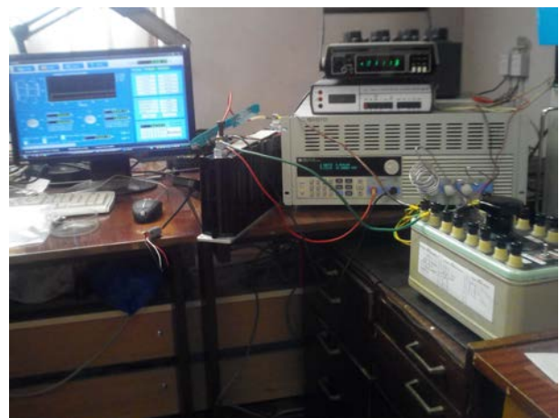
Рис. 5. Вузол відслідковування точки максимальної потужності ФМ на основі ЕК