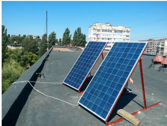
Рис. 3. Вузол ФМ енергоефективної університетської сонячної електростанції