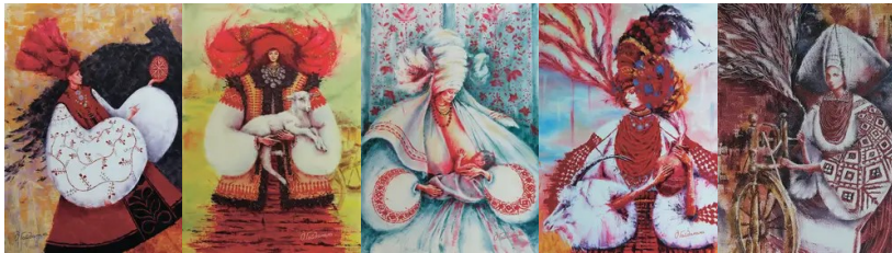
Рис. 2. Патріотичні листівки з українською символікою

Сучасні технології дозволяють створювати листівки з різними ефектами і можливостями: безкоштовна листівка (freecard), листівка ручної роботи (Hand-made card), Інтернет-листівка («e-card», створюється за допомогою цифрових медіа), а також новий художній жанр – мейл-арт є невід’ємною частиною сучасного культурного життя в інформаційному суспільстві [1].