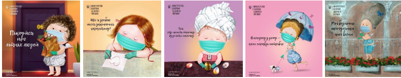
Рис. 1. Рекламні листівки Є. Гапчинської для МОЗ України проти коронавірусу в період карантину

Політична і патріотична листівки (рис. 2) частіше за все містять зображення одиночних героїв минулого і сьогодення (листівки-портрети революційних діячів) або зображення етнокультурних символів або кодів (мати-берегиня, вазонка, дерево життя, символічні орнаменти, фольклорні елементи тощо).