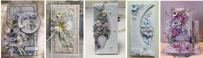
Рис. 4. Приклади листівок ручної роботи (Hand-made card)

Використання техніки ручного виготовлення: шиття, вишивки, вирізування паперу, викладання плетінням тощо. Це надає листівкам особливого шарму (рис. 4).